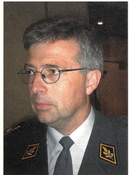
Brigadier Dahinden: «Es herrscht ein offener und transparenter Geist.»

liche Mängel bestünden zum Beispiel im Bereich der Polizei und der Gerichte. Es werde noch viele Jahre dauern, bis die Aufbauarbeit Erfolg habe.