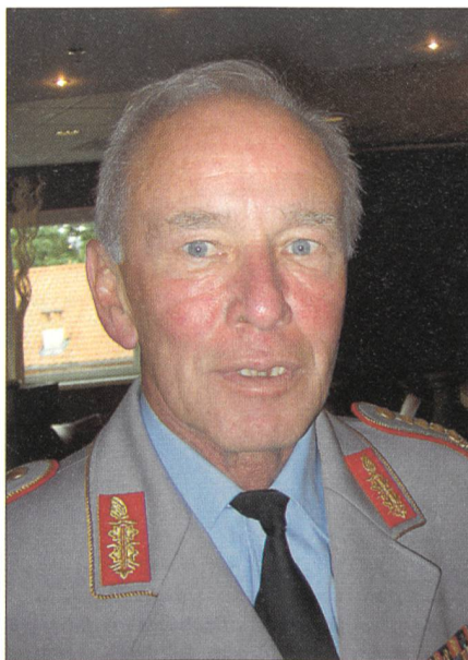
General Schuwirth: «Wir halten Soldaten nur so lange im Einsatz, als das nötig ist.»

liche Mängel bestünden zum Beispiel im Bereich der Polizei und der Gerichte. Es werde noch viele Jahre dauern, bis die Aufbauarbeit Erfolg habe.