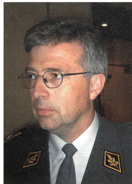
Brigadier Dahinden: «Es herrscht ein offener und transparenter Geist.»

Zu den Status-Verhandlungen merkte Schuwirth an, es bleibe abzuwarten, ob und wann diese zu einem Ergebnis führten. Die NATO stelle sich darauf ein: «Wir halten Soldaten nur so lange im Einsatz,