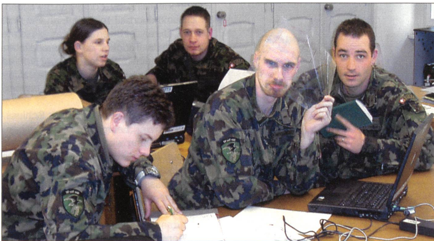
Angehende Feldweibel in Sion.

Am Freitag der 14. Woche hiess es für uns das letzte Mal «Kompanie Achtung ... Abtreten!»