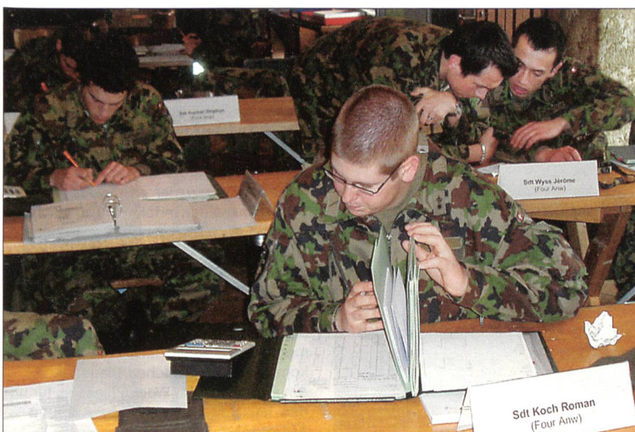
Fourieranwärter erlernen das Handwerk.