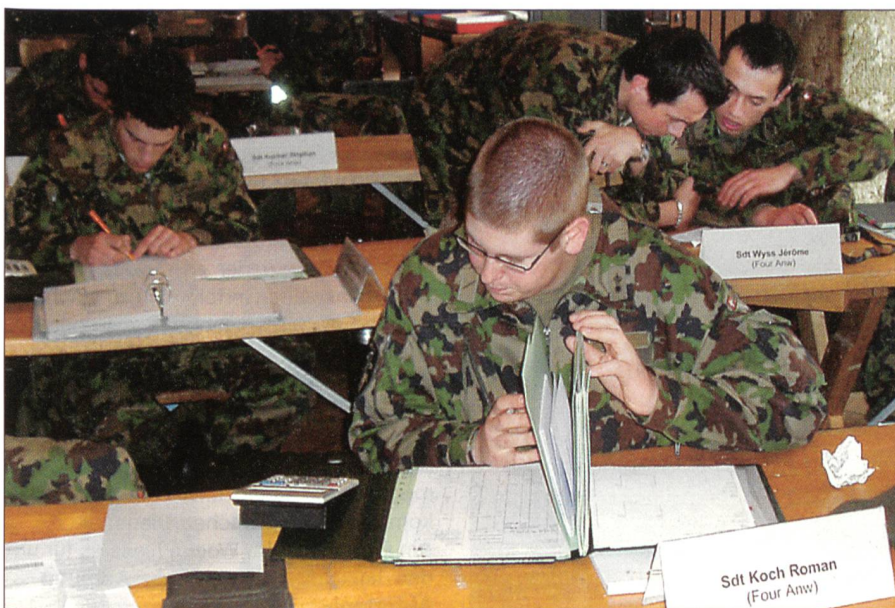
Fourieranwärter erlernen das Handwerk.