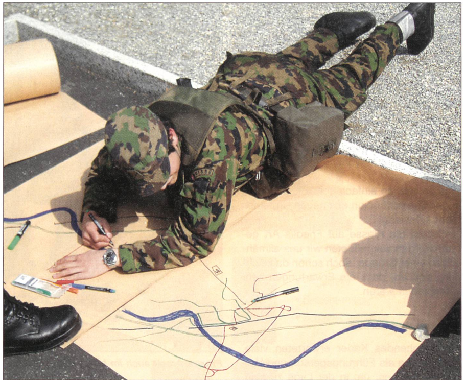
In der Verlegung: Kroki zeichnen.

Zehn ereignisreiche und arbeitsintensive Wochen liegen nun hinter uns. Die ersten Wochen widmeten wir uns ganz den Tücken der militärischen Buchhaltung, die uns anhand der MUBU (Musterbuchhaltung) beigebracht wurde. Viel Zeit wird zudem in die Erarbeitung der FUM-Module (Führungsausbildung der unteren Milizkader) investiert. Diese behandeln die Selbstkenntnis, die persönliche Arbeitstechnik, die Führung der Gruppe, das Konfliktmanagement oder das Personalwesen.