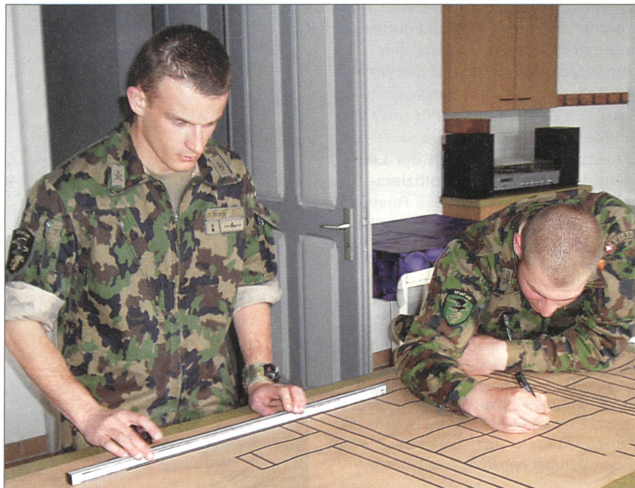
Präzise Arbeit auch im Lehrgang Feldweibel.

Neben einer ausführlichen FUM-Ausbildung, die Themen wie «Selbstkenntnis,