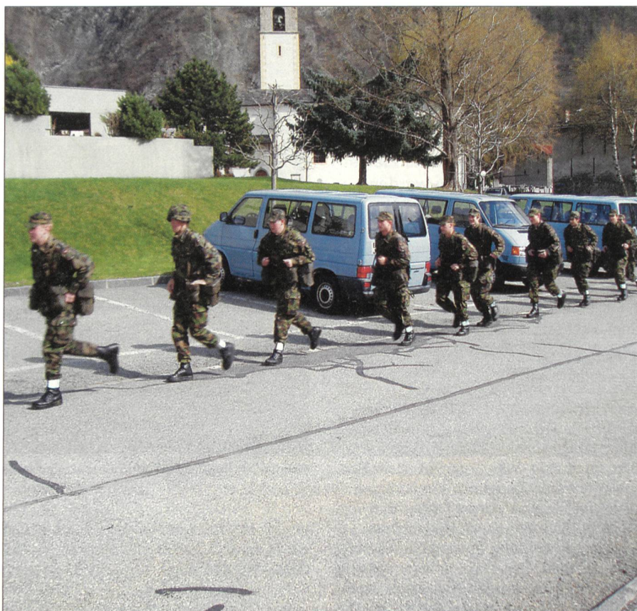
Laufschritt während der Übung RAPPAX im Walliser Dorf Riddes.

Die ersten zehn Wochen finden in der Kaserne Sion statt. Diese sehr moderne Ausbildungsstätte ist dafür ideal. Die Ausbildungsblöcke im Theoriesaal werden immer wieder durch Sport, Märsche, Pistolenschüssen oder praktische Übungen im