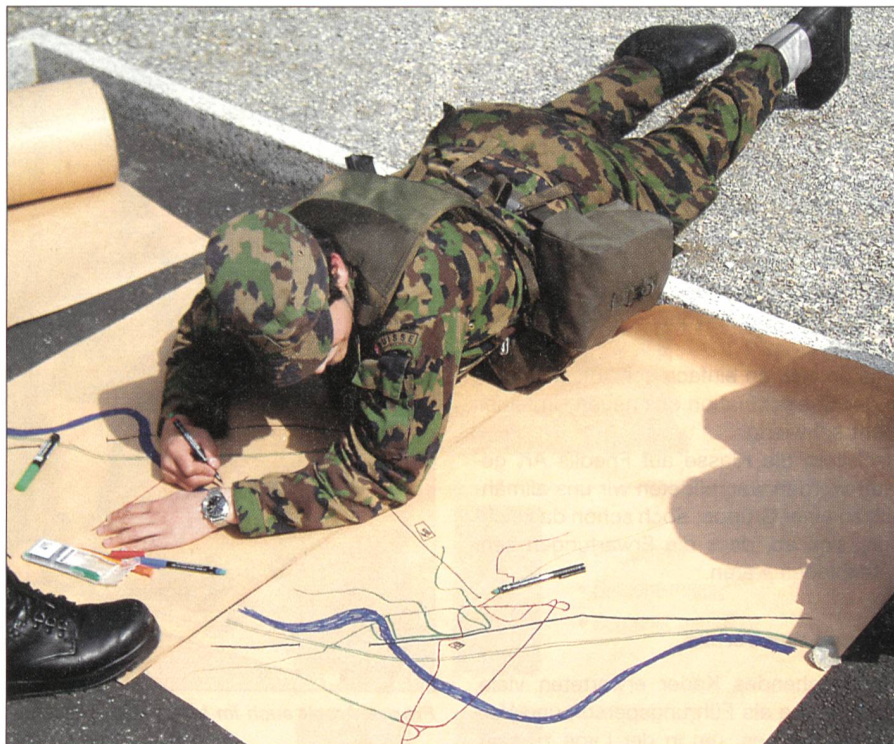
In der Verlegung: Kroki zeichnen.

Zehn ereignisreiche und arbeitsintensive Wochen liegen nun hinter uns. Die ersten Wochen widmeten wir uns ganz den Tücken der militärischen Buchhaltung, die uns anhand der MUBU (Musterbuchhaltung) beigebracht wurde. Viel Zeit wird zudem in die Erarbeitung der FUM-Module (Führungsausbildung der unteren Milizkader) investiert. Diese behandeln die Selbstkenntnis, die persönliche Arbeitstechnik, die Führung der Gruppe, das Konfliktmanagement oder das Personalwesen.