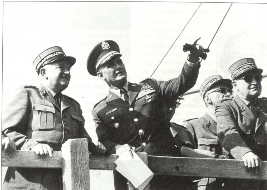
Anlässlich des Besuchs von William C. Westmoreland, Generalstabschef der US-Streitkräfte, leitete Brigadier Jeanmaire (links) eine Demonstration. Rechts im Bild Generalstabschef Paul Gygli. Der Besuch fand vom 11. bis 14. September 1969 statt.