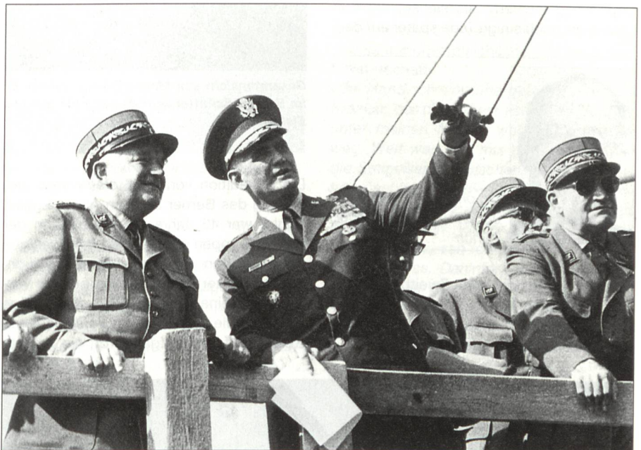
Anlässlich des Besuchs von William C. Westmoreland, Generalstabschef der US-Streitkräfte, leitete Brigadier Jeanmaire (links) eine Demonstration. Rechts im Bild Generalstabschef Paul Gygli. Der Besuch fand vom 11. bis 14. September 1969 statt.