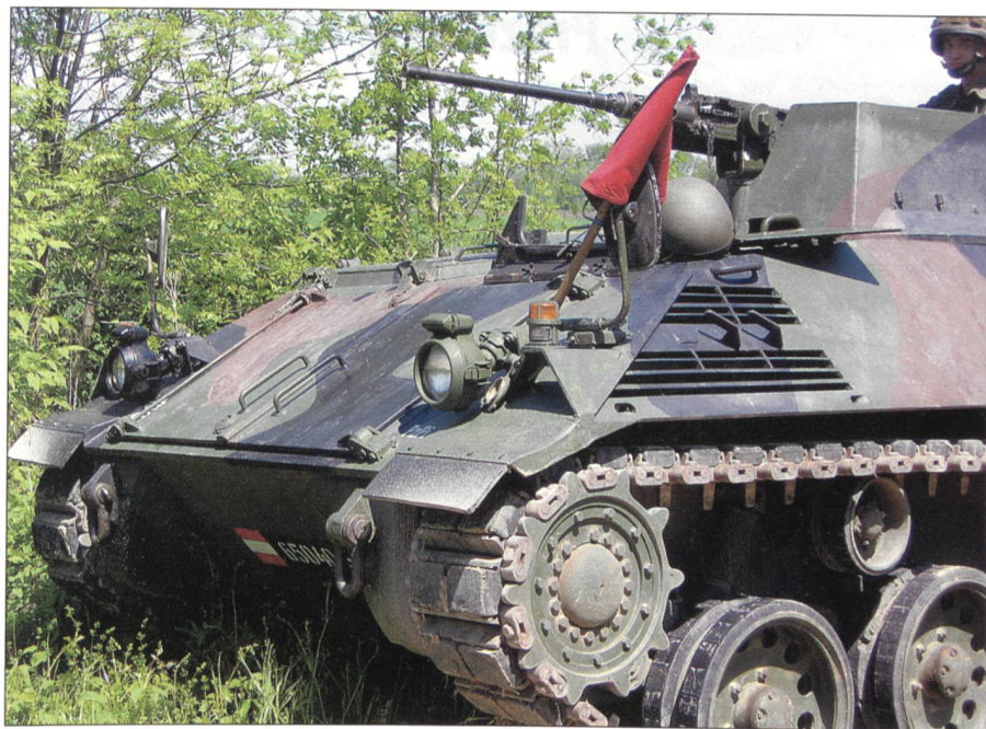
Während ihrer Prüfung werden die Militärbeobachter mit bedrohlichen Situationen konfrontiert, hier mit einer feindlich gesinnten Truppe mitten im Panzerkorridor.

In einem nächsten Posten hält eine feindlich gesinnte Freischärlertruppe die Beobachter mit Panzern, Raketenrohren und Maschinengewehren auf. Ein kanadischer