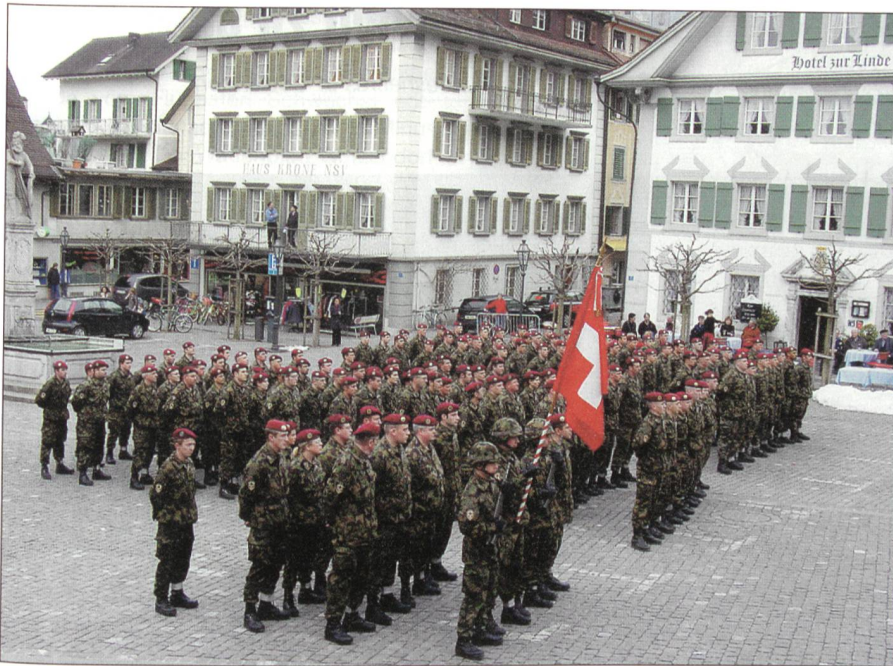
Die feierliche Verabschiedung des 14. Swisscoy-Detachementes auf dem Dorfplatz in Sarnen.

terie der Swisscoy ist auch befähigt, defensiven Ordnungsdienst bei möglichen Demonstrationen und Unruhen zu garantieren. Alles, was im Einsatz bei Swisscoy getan werden müsse oder vorkommen könne, übten hier die Kursteilnehmer im Massstab 1:1, begründete Kdt Stv Stefano Brunetti das Ausbildungskonzept der Infanterie.