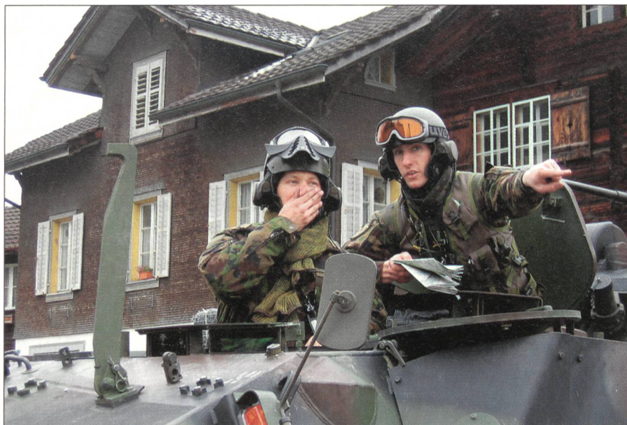
Am Kontrollposten «Sachseln».

Die SWISSCOY erledigt den Auftrag gemäss Parlamentsbeschluss vom Dezember 2001. Zum Selbstschutz darf das Kontingent kleinkalibrige Waffen (Pistole und Sturmgewehr) einsetzen. Die mechanisierte Infanterie ist ausgerüstet mit Radschützenpanzern Piranha und versieht Sicherungsaufgaben wie Campwache, Kontrollposten, Patrouillen und Konvoischutz. Der KOVOR stellt der Swisscoy einen Schweizer-Armee-Helikopter (Super Puma) für Transportflüge zur Verfügung. Dazu kommt der logistische Grundauftrag: Transport, Wasseraufbereitung, Treibstoffversorgung,