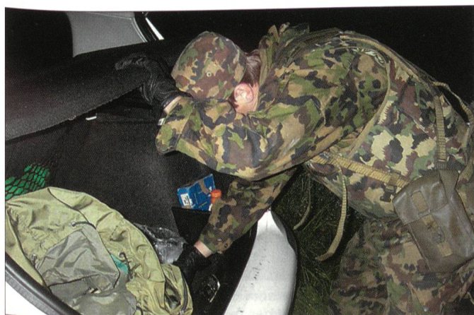
Fahrzeugkontrolle in Hauterive.