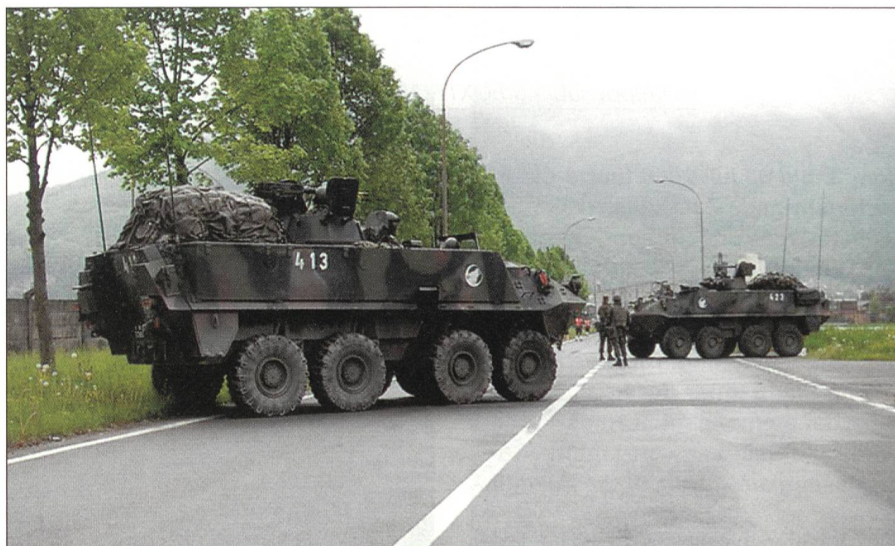
Radschützenpanzer in Collombey (VS).

Einige Sorgen machte sich noch der Quartiermeister des Bataillons, Hptm Roth. Er musste die Art der Mittagsverpflegung bei den Kompanien an diesem ersten Übungstag wohl dem Einfallsreichtum der jeweiligen Fouriere überlassen, da Kampfportionen, durch die LBA bzw. das Mob Log Bat 52 erst am Abend nach 18 Uhr geliefert würden. Um 11.15 Uhr war es dann so weit: von der Brigade kam das GO. Als die Stabsangehörigen des Inf Bat 13 die Mezzener Kaserne in Bern verliessen, begann es wie aus Kübeln zu giessen.