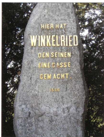
Der Gedenkstein für Arnold von Winkelried.