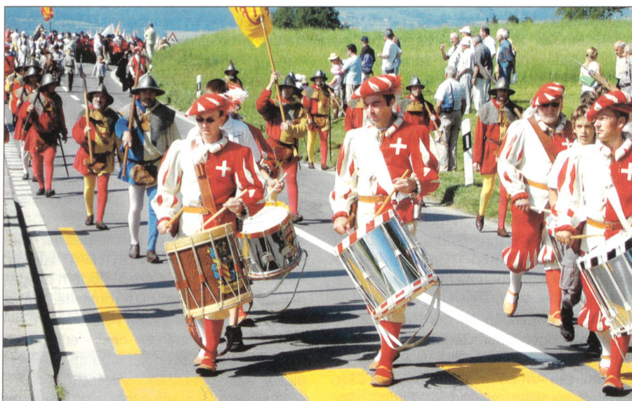
Der Einzug der Abordnungen nach dem Festzug von Sempach auf das Schlachtfeld.