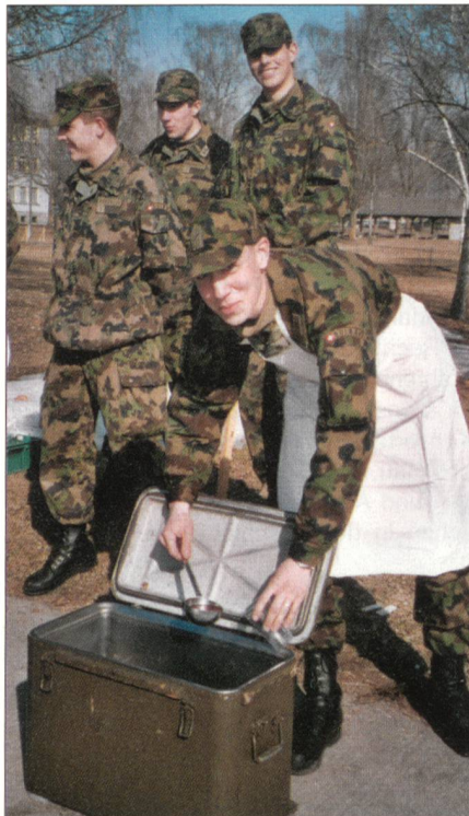
Bei so viel welschem Charme lässt man sich gerne Tee nachfüllen.