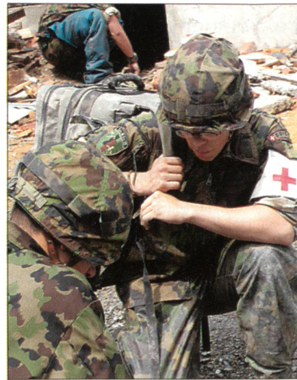
Absprache auf dem Schadensplatz.