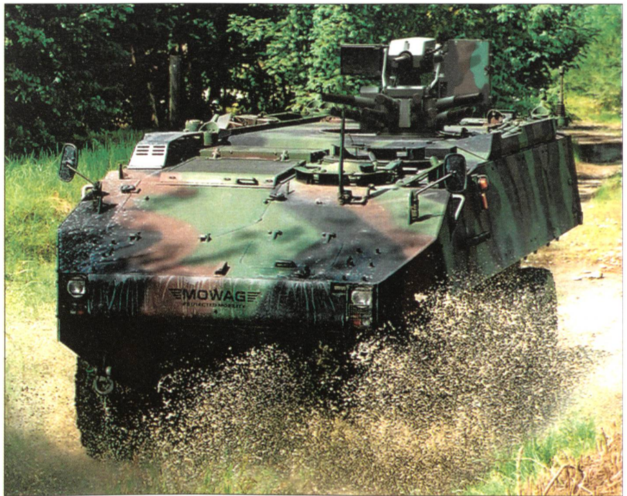
Der Piranha III C könnte nicht mehr nach Belgien ausgeführt werden.

Mit dem Bundesratsentscheid vom 11. Mai 2005 wird die Verteidigungsfähigkeit der Schweizer Armee auf wenige Aufwuchskerne reduziert. Bei einer Veränderung der sicherheitspolitischen Lage müsste die Armee «aufwachsen», z.B. in Bezug auf Ausrüstung, Bewaffnung, Dienstleistungsdauer und Verteidigungsbudget. Eine Conditio sine qua non für das Funktionieren dieses z.T. bestrittenen Aufwuchskonzepts ist die Erhaltung einer ausreichenden schweizerischen Industriebasis mit dem entsprechenden technologischen Know-how. Mit einem Ausfuhrverbot würde der Rüstungsindustrie die Existenzgrundlage entzogen, nachdem die Schweizer Armee um zwei Drittel geschrumpft ist. Das Aufwuchskonzept und damit die Grundlage der militärischen Landesverteidigung wäre fundamental gefährdet. Dies kann die AWM unter keinen Umständen akzeptieren.