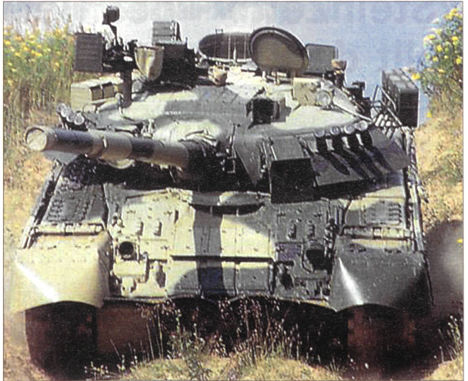
Der T-80U der russischen Armee.

Auf russischer Seite ist die Rüstung und Entwicklung von Panzern nach der sowjetischen Zeit praktisch zum Erliegen gekommen. Der T-80U gilt als der modernste eingeführte Panzer der russischen Armee. Die russischen Konstrukteure konnten auf Grund des eklatanten Geldmangels keine weiteren Neuentwicklungen mehr vornehmen. Zwar wurde noch ein T-90S entwickelt, aber nicht mehr im grossen Stil eingeführt. Als erster Panzer hat er nicht nur eine Panzerkanone (125 mm), ein Koaxial Mg (7,62 mm) und ein Flab Mg (12,7