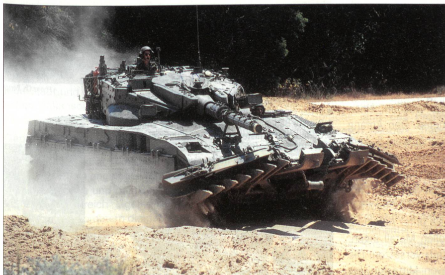
Der Merkava ist Israels modernster Panzer und bildet heute das Rückgrat seiner Bodentruppen. Auf dem Bild die Minenräum-Version.

Obwohl das Waffensystem immer komplexer und daher auch teurer wird, können Armeen auf seine Durchschlags- und Feuerkraft nicht verzichten. Rasch wird man den Panzer auf seine neuen Aufgaben anpassen, aber er wird seine Rolle kaum einbüßen. +