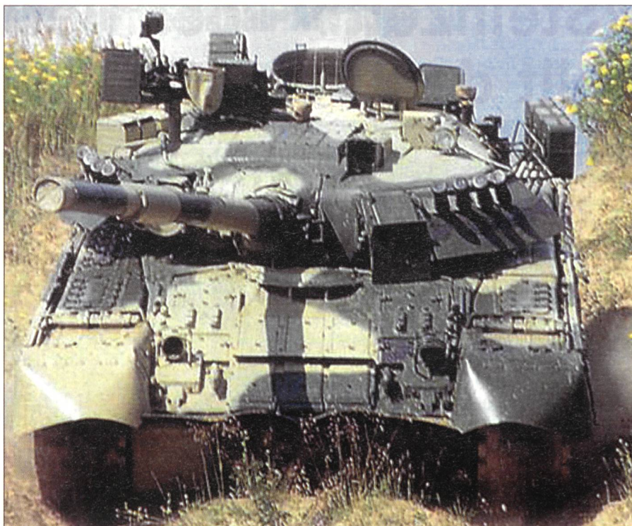
Der T-80U der russischen Armee.

Auf russischer Seite ist die Rüstung und Entwicklung von Panzern nach der sowjetischen Zeit praktisch zum Erliegen gekommen. Der T-80U gilt als der modernste eingeführte Panzer der russischen Armee. Die russischen Konstrukteure konnten auf Grund des eklatanten Geldmangels keine weiteren Neuentwicklungen mehr vornehmen. Zwar wurde noch ein T-90S entwickelt, aber nicht mehr im grossen Stil eingeführt. Als erster Panzer hat er nicht nur eine Panzerkanone (125 mm), ein Koaxial Mg (7,62 mm) und ein Flab Mg (12,7