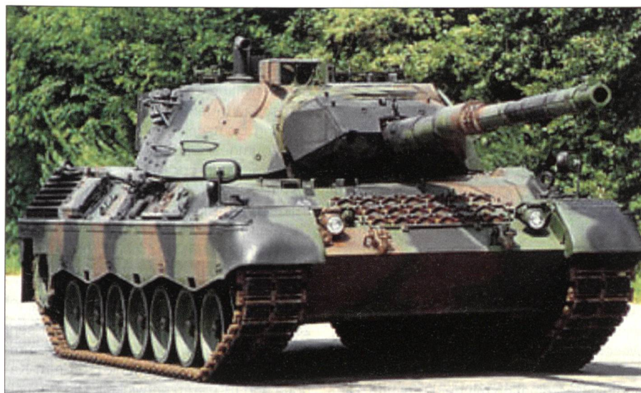
Der Leopard-1 mit seiner 105-mm-Kanone.

Gleichzeitig wurden in den USA der Abrams M1 und in Deutschland der Leopard 2 entwickelt und produziert. Der amerikanische Abrams wurde erstmals mit einer Gasturbine als Antrieb versehen. Sie sollte ihm die nötige Energie geben, die er be-