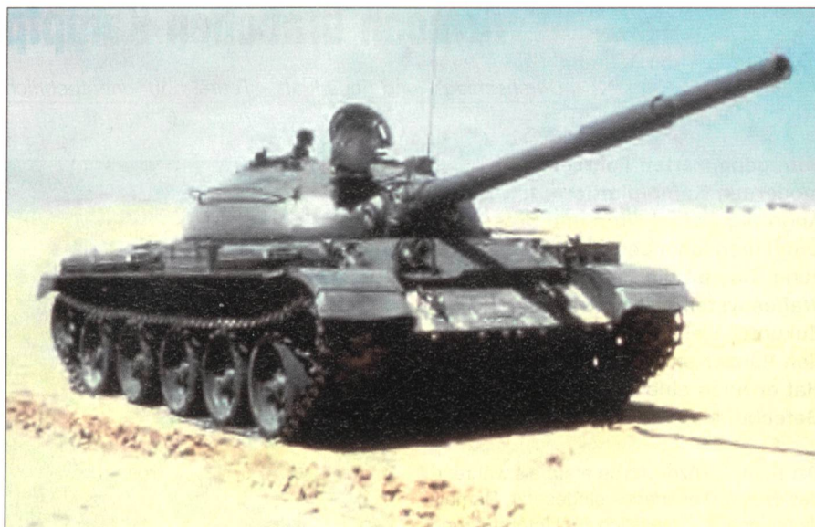
Der T-55 mit seiner 100-mm-Kanone.

Da in diesem Zeitpunkt die Bewegung einen Schutz darstellte, wurden ebenfalls Rohrstabilisatoren entwickelt, welche es der Panzerbesatzung erlaubten, aus dem