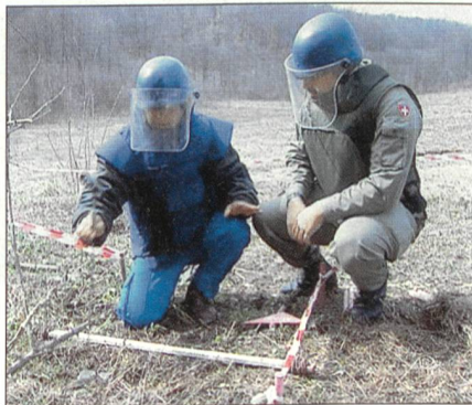
Detachement für Minenräumung.

Missionen eingesetzt werden können. Dabei ist aber festzuhalten, dass aufgrund der komplizierten Logistik der Einsatz einzelner Kompanien in diversen Missionen massiv teurer wird als der eines gesamten Bataillons für eine Mission.