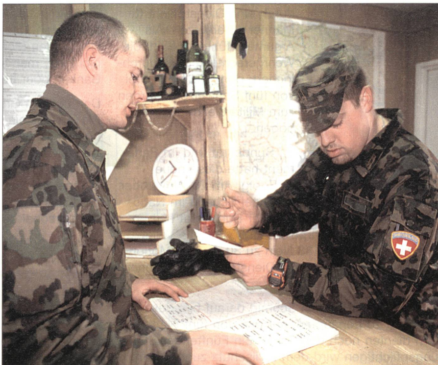
Schweizer im Auslandseinsatz.

In Peace Support Operations (PSO) nehmen Schweizer Truppen wie zum Beispiel die Schweizer Kompanie (Swisscoy) bei der Kosovo Force (KFOR) im Kosovo oder auch gewisse UNO-Militärbeobachter auch Aufträge im Bereich der Raumsicherung und -stabilisierung wahr. Die jeweilige Lageentwicklung kann innerhalb von Stunden einen gewalttätigen Einsatz zum Selbstschutz oder zur Verteidigung bzw. Durchsetzung des Mandates nötig machen. Die Schweizer Truppen sind dabei nicht Trittbrettfahrer und müssen sich einer solchen Situation stellen. Auch wenn diese zu Schwierigkeiten und Gefährdungen der Truppen vor Ort führen kann. Im Ansatz geschah dies bei der Swisscoy im Frühling 2004 beim Ausbruch spontaner grösserer