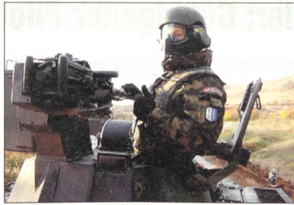
Auf Patrouille im Kosovo.

Grundsätzlich ist von einem Ablösungsturnus von sechs Monaten auszugehen. In diesem Rahmen müssen vermehrt aktiv Kooperationsformen mit der Wirtschaft gesucht werden, weil ein SWISSBAT-Einsatz mit seinen diversen Erfahrungen gerade auf Kaderstufe auch viele nützliche Erkenntnisse für eine zivile Führungsfunktion generiert. Das SWISSBAT muss modular aufgebaut werden, damit im Bereich CIMIC bei einer Prioritätenänderung auch nur ein Teil des SWISSBAT ausgetauscht werden kann oder einzelne Kompanien in verschiedenen