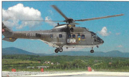
Schweizer Cougar-Helikopter im Einsatz.