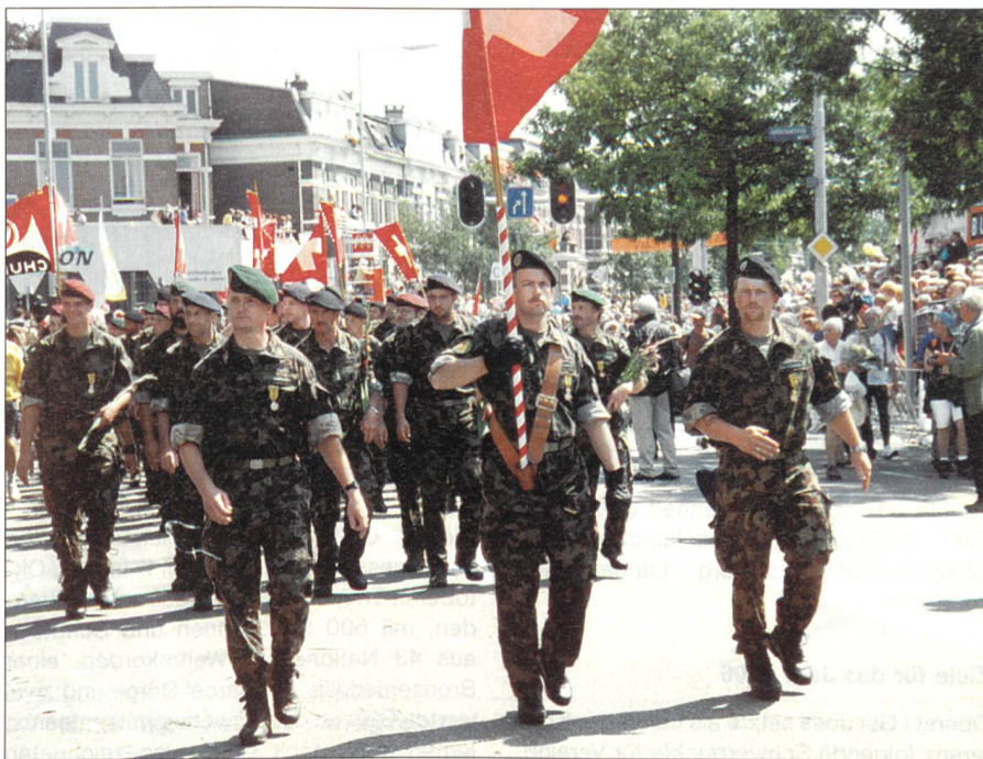
Militärgruppe in Nijmegen.

Wie immer kann man sich online anmelden, dies auf der Internetseite www.2tagemarsch.ch , wo weitere interessante Informationen abgerufen werden können. Weitere Auskünfte sind auch über die E-Mail-