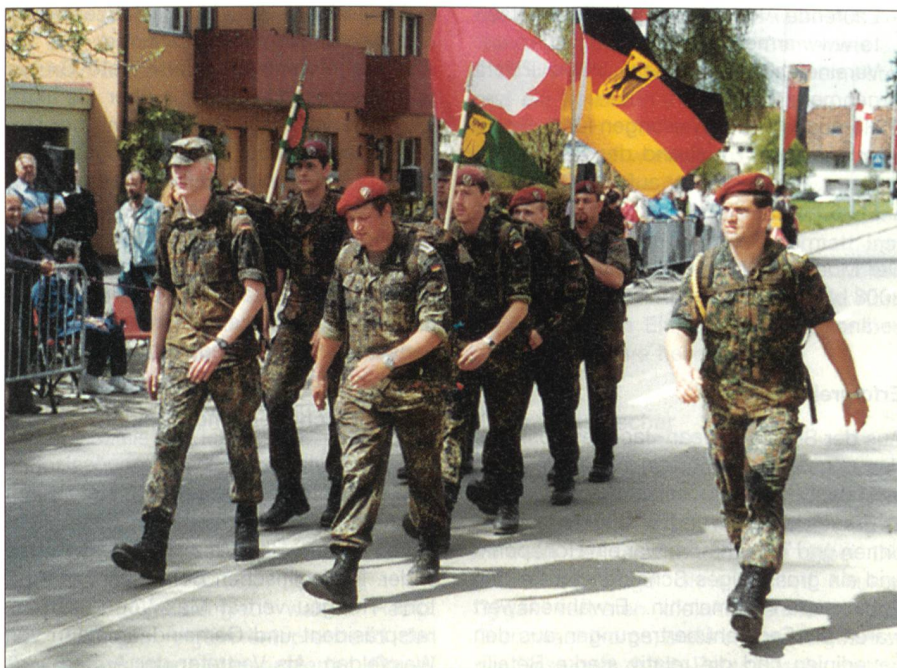
Eine multinationale Marschgruppe, zusammen geht es leichter.