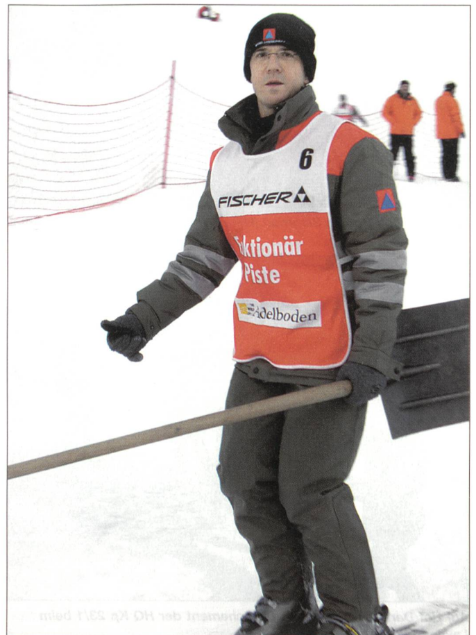
Ein Zivilschützer als Pistenfunktionär unterwegs zum Einsatz.