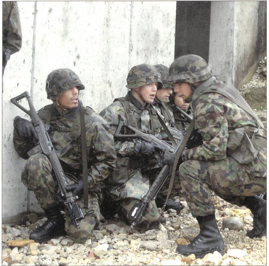
Perspektiven der Zukunft: Einsatz im überbauten Gelände.

Begründet wird der vorgeschlagene Entwicklungsschritt 2008/2011 vom VBS mit der veränderten Bedrohungslage: «Im Vordergrund der Gefahren stehen Terrorismus, Natur- und technische Katastrophen sowie Auswirkungen bewaffneter Konflikte