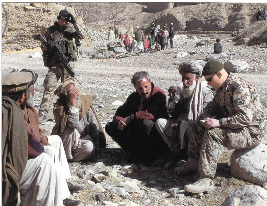
Deutsche Soldaten des PRTs in Kunduz mit der Bevölkerung.

Das Konzept der PRTs wurde ursprünglich 2002 durch die von den USA geführte Koalition eingeführt. Man wollte damit «die Herzen und Gefühle» der Bevölkerung im Kontext mit der «Operation Enduring Freedom» gewinnen. Es war eine Antwort auf