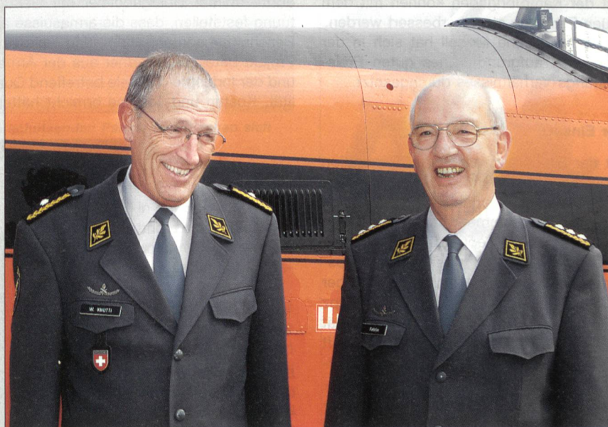
Walter Knutti löste per 1.1.2006 Hans-Ruedi Fehrlin als Kommandant der Luftwaffe ab.