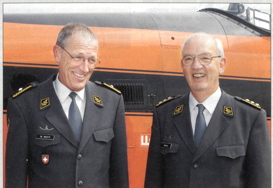
Walter Knutti löste per 1.1.2006 Hans-Ruedi Fehrlin als Kommandant der Luftwaffe ab.