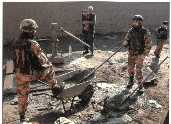
Das PRT bei der Arbeit.

Kommando West von ISAF) unter italienischer Führung errichtet. ISAF-Operationen werden um einen regionalen Mittelpunkt, bekannt als Forward Support Base (FSB-Vorgeschobene Unterstützungs-Basis) errichtet, wodurch PRTs in den Provinzen unterstützt werden. ISAF übernahm nun auch die Führung der FSB in den Aussenbezirken von Herat-Stadt, in der Provinz Herat. In dieser Basis sind unter spanischer Führung eine Schnelle Reaktions-Truppe sowie ein spanisches Spital mit Operations- und medizinischen Evakuierungsfähigkeiten enthalten. Insgesamt sind mehr als 375 militärische und zivile Personen in der FSB stationiert. Darüber hinaus hat Italien die Verantwortung über das PRT in Herat-Stadt übernommen, während Spanien ein PRT in Qal-eh Now, in der Bandisghis-Provinz, errichtet. Das PRT in Farah-Stadt, in der gleichnamigen Provinz, wird weiterhin von den USA