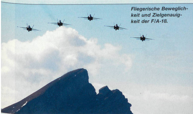
Fliegerische Beweglichkeit und Zielgenauigkeit der F/A-18.