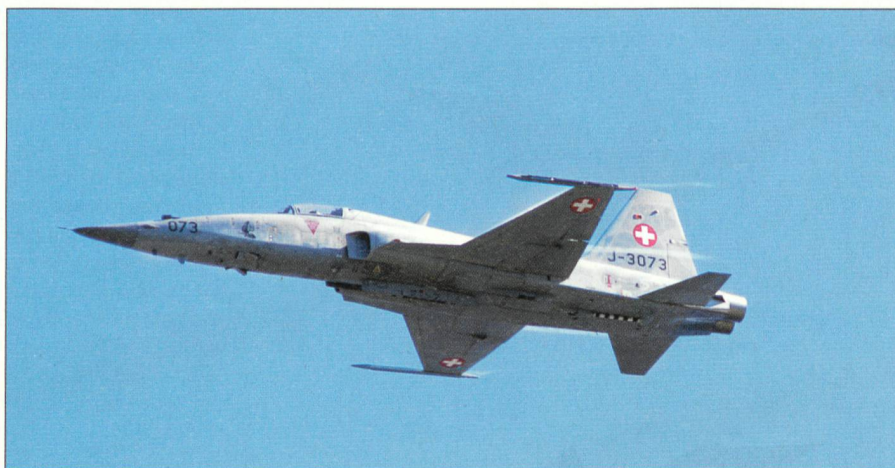
Tiger F-5 beim Kanonenschieszen.