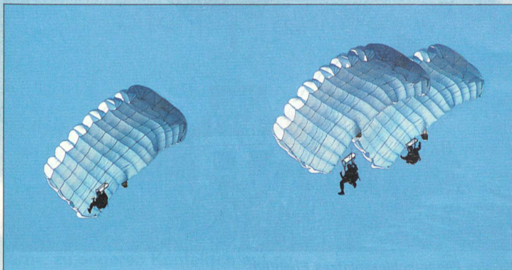
Fallschirmaufklärer nach Absprung aus einem Pilatus-Porter.