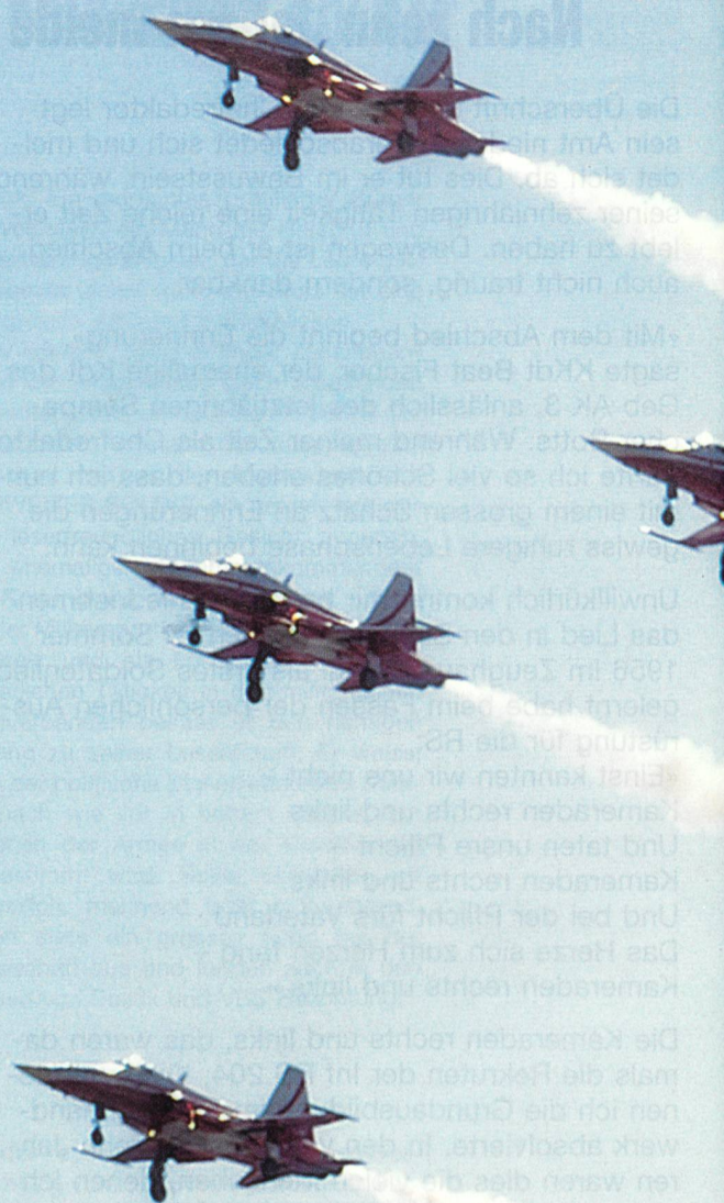
Die Vorführung der Patrouille Suisse konnten die Zuschauer hautnah und auf Augenhöhe erleben.

Punkt 14.00 Uhr wurde das Programm mit einem überraschenden und spektakulären Cougar-Auftritt eröffnet. Beim ersten Vorbeiflug des modernen Transporthelikopters liessen die Piloten 128 Flares aus dem Selbstschutzsystem Issys ausstossen und begeisterten mit dem schönen Lichtzauber das Publikum. Anschliessend wurde die Flugleistung und die Wendigkeit des Cougar-Helikopters eindrücklich demonstriert. Eine supponierte Rettungsaktion im Gebirge mit einer Alouette III, der Absprung von Fallschirmaufklärern aus einem Pilatus-Porter sowie die Feuerlöschdemonstration zweier Super-Puma-Helikopter waren die nächsten Programmpunkte.