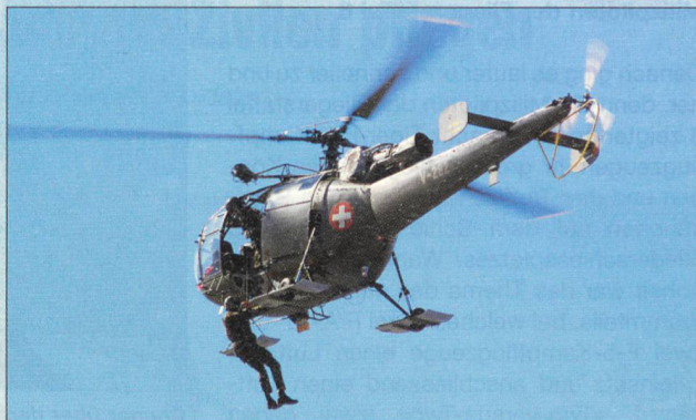
Rettungseinsatz mit einer Alouette III.