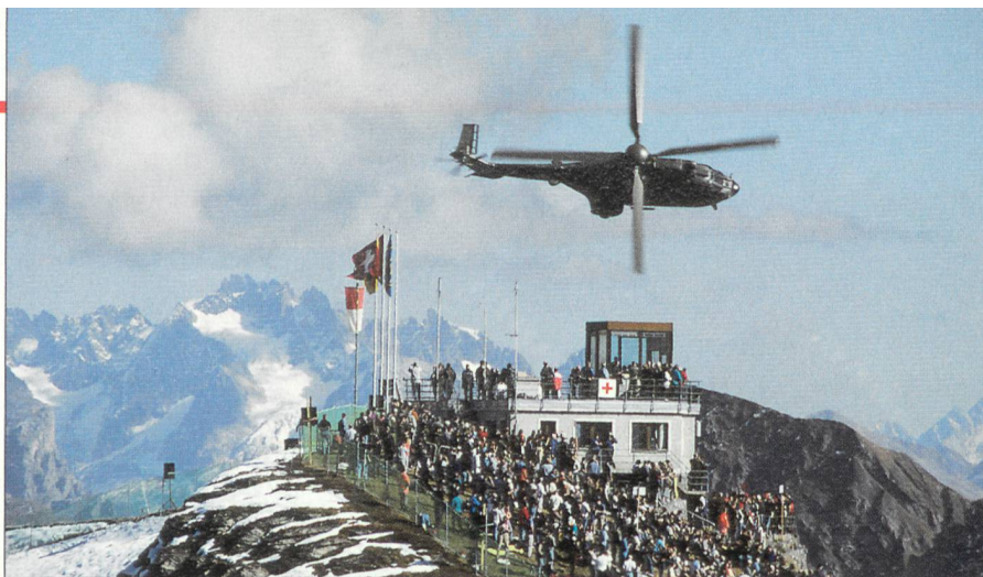
Cougar über dem KP des Fliegerschiessplatzes Ebenfluh.