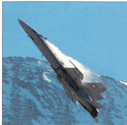
Display-Pilot mit atemberaubender Vorführung mit dem F/A-18.