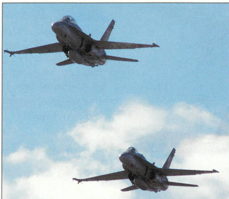
Überflug der Hornets.