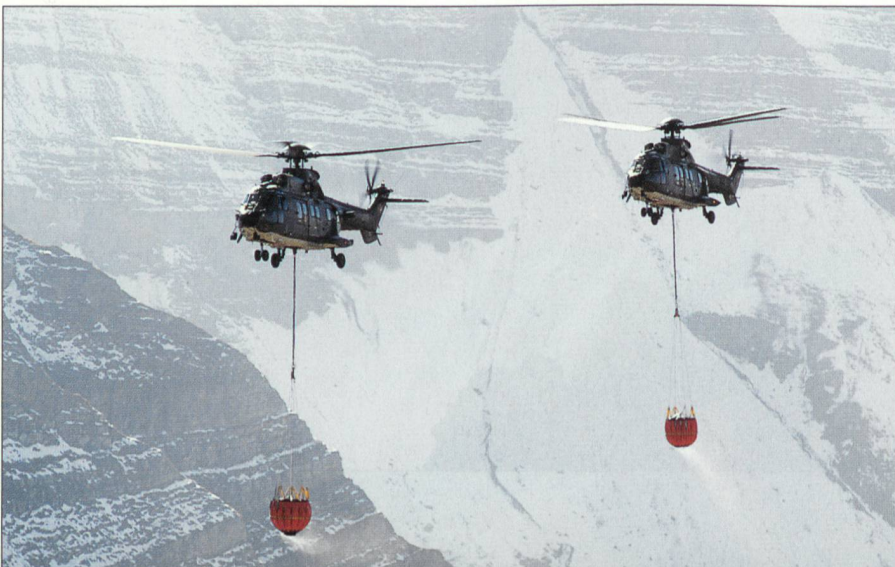
Löscheinsatz mit Super Puma.