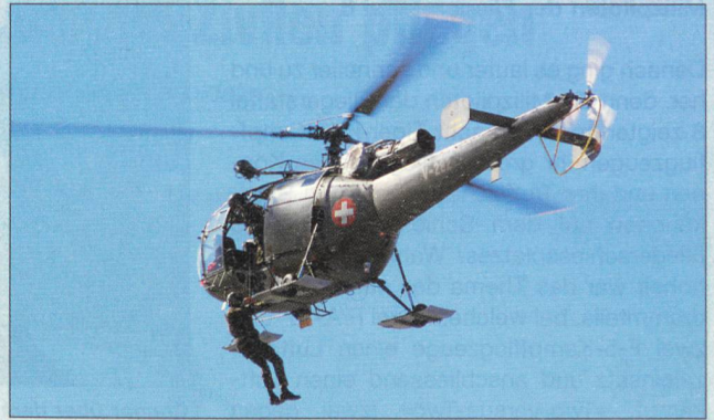
Rettungseinsatz mit einer Alouette III.