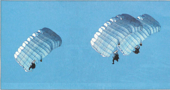
Fallschirmaufklärer nach Absprung aus einem Pilatus-Porter.