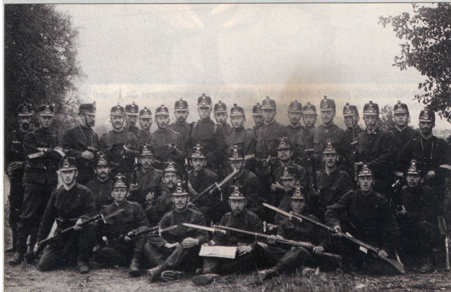
Für ungepflegte Waffen gabs für unsere Vorväter schon Bussen: Altes Kompaniebild des Zürcher Füs Bat 70 mit aufgesetztem Bajonett!

Die einsetzende Herrschaft des Liberalismus bringt dem Kanton Zürich neben der Kantonsverfassung auch ein Militärorganisationsgesetz für den Kanton Zürich vom 8.8.1832 hervor. In dieser Zeit werden auch die «Sectionschefs» zum ersten Mal erwähnt. Im «Reglement betr. Anstellung und Verrichtungen der Sectionschefs in den Quartieren» vom 22. 7. 1833 wird festgehalten, dass die Quartierkommandanten für jede Gemeinde einen Sektionschef anzustellen haben. Dieser soll zuvor Exerzier- oder Schützenmeister gewesen sein. Offiziere und Unteroffiziere der Landwehreinfanterie werden für diese Aufgabe bevorzugt. Die Sektionschefs führten Namensverzeichnisse der dienstpflichtigen Mannschaft, hatten Militärflichtersatz und Bussen einzuziehen und alle Aufträge vorgesetzter militärischer Stellen auszuführen. Die Entschädigung für die Sektionschefs bestand aus einem Anteil am Militärflichtersatz und an den Bussen. Schon von Anfang an gabs für die Sek-