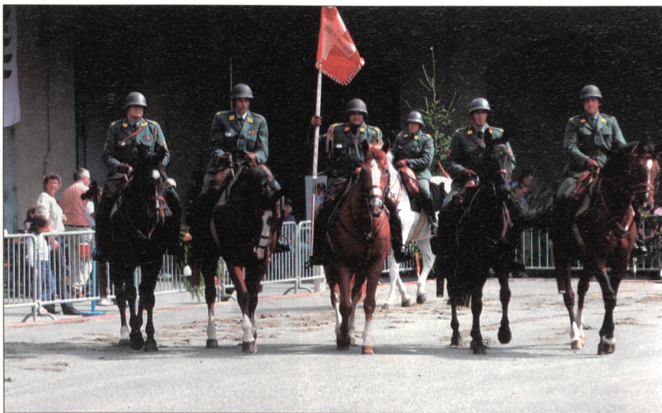
Das Einreiten der Schwadron war eindrücklich.