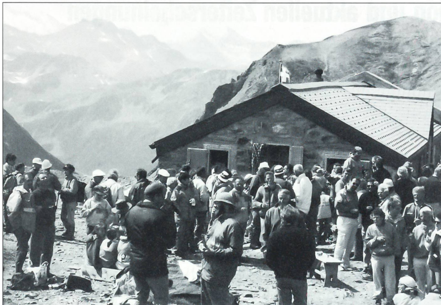
Kaltwasserhütte, 2851 m ü. M., am Kaltwasserpass Schweiz-Italien.

zu nennen pflege, zu treffen. Wie heisst es doch so zuversichtlich im römischen Epos von Corippus (6. Jh. n. Chr.), was uns der Lateinlehrer im Gymnasium zu verstehen gab zum Trost der EMERITI: Tempora permultas nec tu mutaris in illis ( Du gibst den Zeitverhältnissen zwar ein anderes Gepräge, selbst aber änderst du dich in ihnen nicht).