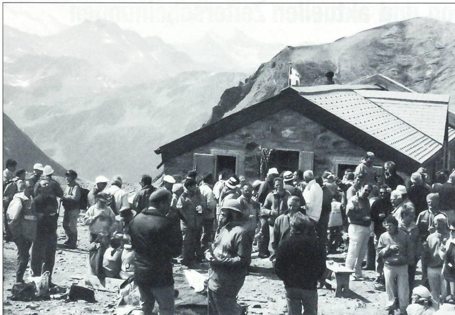
Kaltwasserhütte, 2851 m ü. M., am Kaltwasserpass Schweiz-Italien.

zu nennen pflege, zu treffen. Wie heisst es doch so zuversichtlich im römischen Epos von Corippus (6. Jh. n. Chr.), was uns der Lateinlehrer im Gymnasium zu verstehen gab zum Trost der EMERITI: Tempora permultas nec tu mutaris in illis ( Du gibst den Zeitverhältnissen zwar ein anderes Gepräge, selbst aber änderst du dich in ihnen nicht).