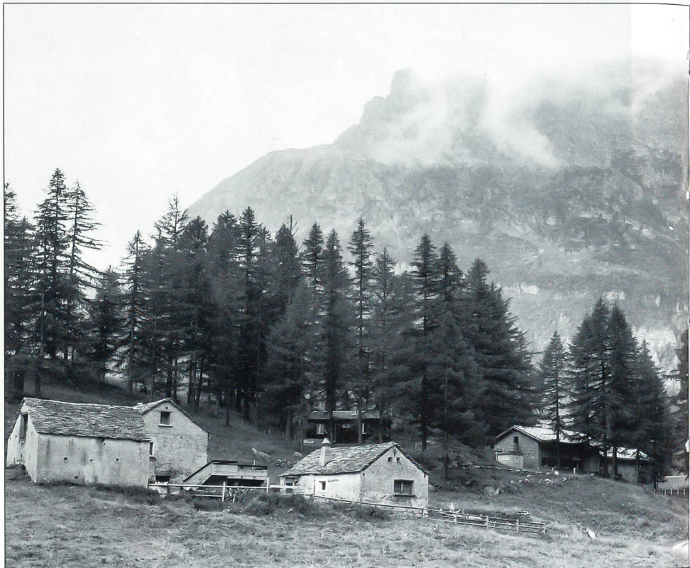
Militärbauten auf Alpen, 1586 m ü. M., heute Ferienlager.

Alle Verteidigungspläne der seit 1815 aufgestellten schweizerischen Truppenkontingente enthalten Hinweise auf Befestigungswerke mit dem Grundkonzept: Kampfführung in einem natürlich starken und in einem stark befestigten Gelände. Das stark befestigte Gelände lief unter dem Deckmantel GEHEIM, wurde jedoch «sinnigerweise» als FOTOGRAPHIEREN VERBOTEN gekennzeichnet. Der Aufwand für die Festungswerke der Schweizer Armee war riesig gross und nicht zuletzt eine potenzielle Kriegsverhinderung, was die Thematik der Befestigungen, als Rückhalt und Anlehnung für das stehende Heer, festigte. Der 1870/71er-Krieg hat die führenden Köpfe in vermehrter Masse mit dem Befestigungssystem beschäftigt. Die Grundkonzeption der Landes- und Grenzbefestigungen mit einer adäquaten Verteidigung bewährte sich in den beiden Weltkriegen und dauerte fort bis zur Armee 95. Nicht unbedingt als befestigt sind die Truppenunterkünfte über den gesamten Grenzraum entstanden mit dem Zweck, dass jede Gebirgstruppe ihr Basislager hatte. Eine besondere Beachtung haben jene erhalten, die unter der Bezeichnung Schutzhütten an den Alpenpässen gebaut wurden. Interessant ist deren Entstehungsgeschichte in den ersten Jahren des letzten Jahrhunderts: Hütten für die Bedürfnis-