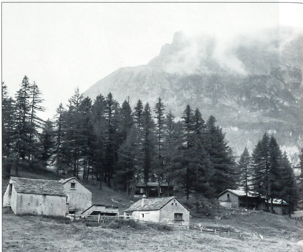
Militärbauten auf Alpen, 1586 m ü. M., heute Ferienlager.

Militärbauten im gesellschaftlichen Umfeld