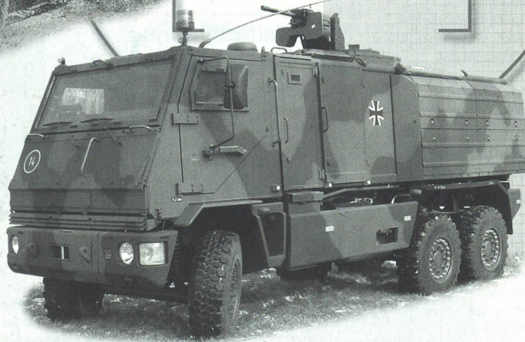
DURO III P 6x6