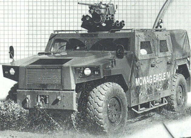
EAGLE IV 4x4