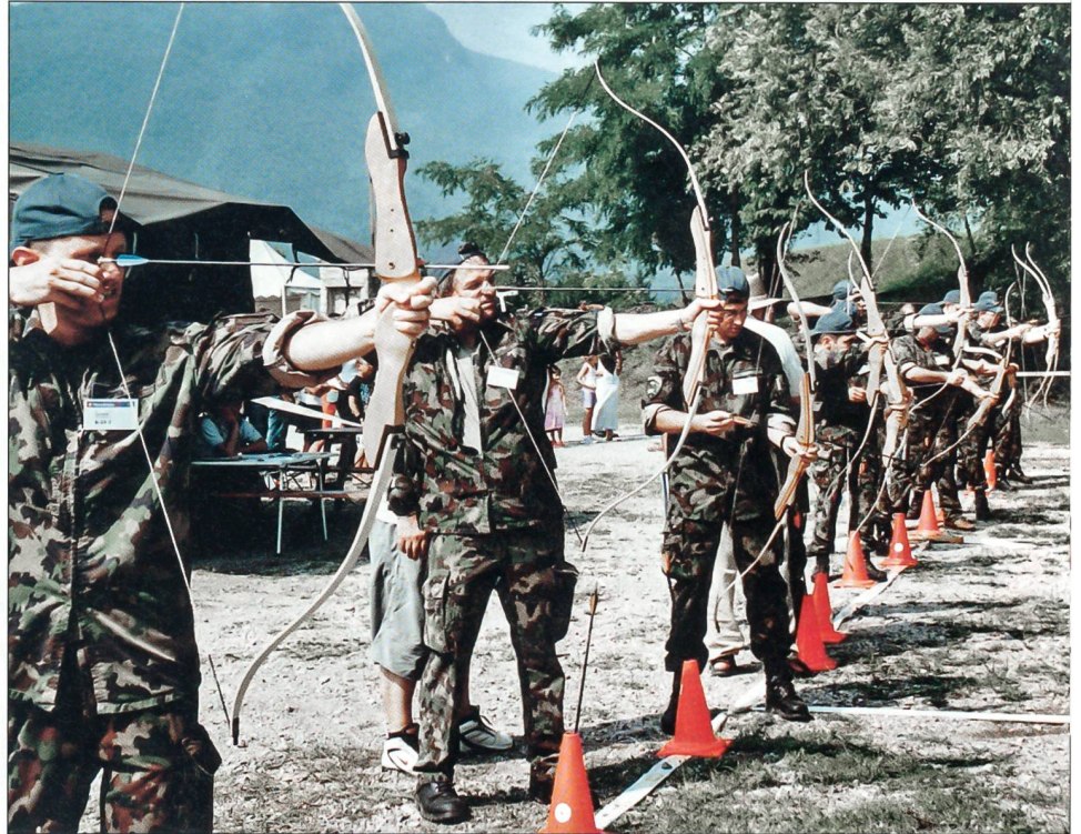
Attraktives und aussergewöhnliches Wettkampfelement: Bogenschiessen.

Das Wetter machte diesem Vorhaben einen Strich durch die Rechnung. Vor allem die Wettkämpfer und Zuschauer sind während der rund eineinhalb Stunden dauernden Eröffnungsfeier zum Teil heftigen Regenfällen ausgesetzt gewesen, was bei einigen Wettkämpfern Unmutsbekundungen aus-