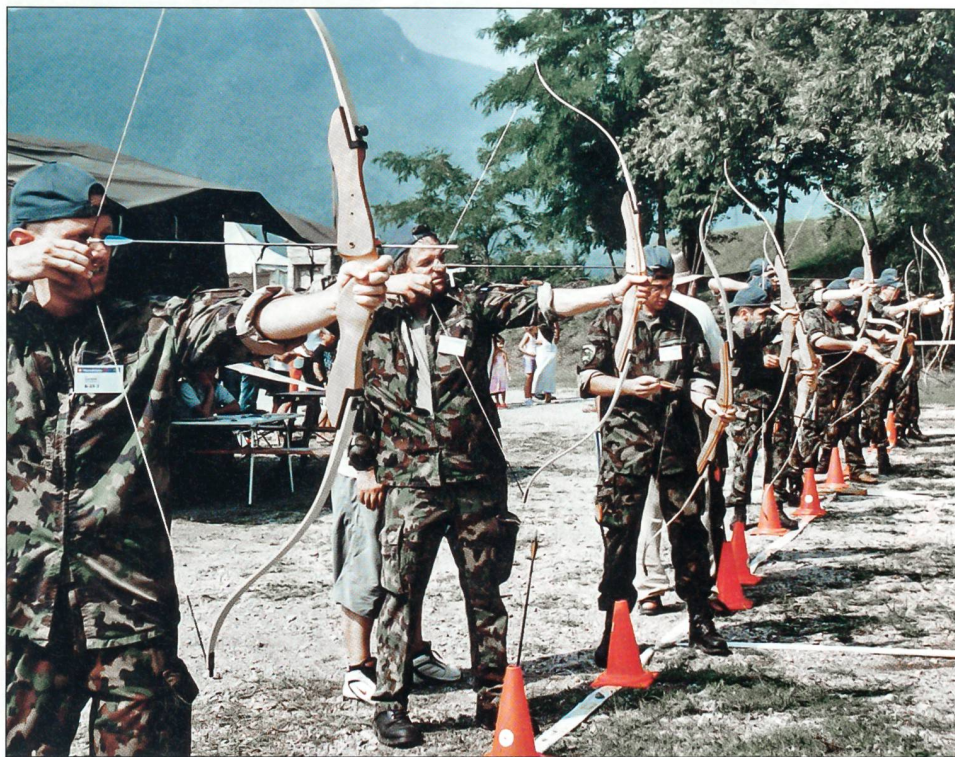
Attraktives und aussergewöhnliches Wettkampfelement: Bogenschiessen.

Das Wetter machte diesem Vorhaben einen Strich durch die Rechnung. Vor allem die Wettkämpfer und Zuschauer sind während der rund eineinhalb Stunden dauernden Eröffnungsfeier zum Teil heftigen Regenfällen ausgesetzt gewesen, was bei einigen Wettkämpfern Unmutsbekundungen aus-