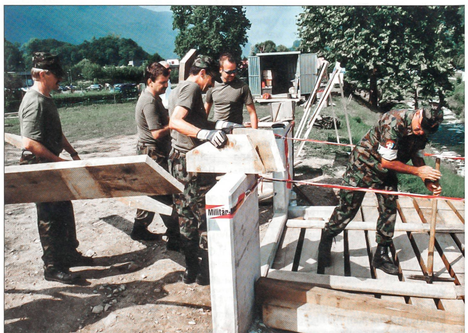
Etwas von der SUT 05 bleibt bestehen: Alle Wettkämpfer beteiligten sich beim Brückenbau.

Als Dank für die gute Aufnahme der SUT in Mendrisio und als Zeichen der Verbundenheit zur Bevölkerung ist durch alle SUT-Teilnehmer eine stabile Fussgängerbrücke erstellt worden. Damit sind beide Seiten der Ebene von San Martino dauerhaft verbunden.