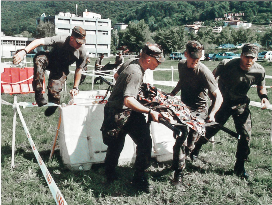
Kräfte raubender Hindernisparcours: Mit einer 40 kg schweren Bahre unterwegs.

schwinden die Kräfte. Die Bahre überschlägt sich, wertvolle Zeit geht verloren. Am Ende der Hindernisbahn gratulieren sich alle zum Erreichten, dies trotz des Missgeschicks. Auch beim ABC- und HG-Posten oder bei den Aufgaben Gruppenführung und Pz/Flz-Erkennung wird mit voller Konzentration gearbeitet.