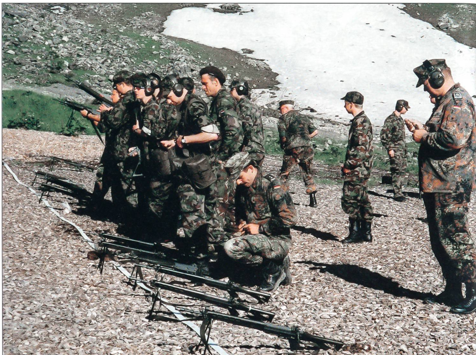
Waffenausbildung am Sturmgewehr 90.

und erlaubt das gleichzeitige Schiessen an mehreren Posten, ohne dass die Sicherheit gefährdet ist. Sehr einfach ist dagegen die Unterkunft im Massenlager über einem