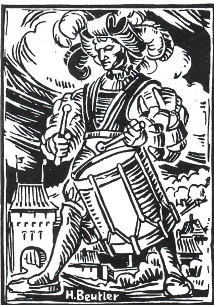
Manche seiner Sujets während der Kriegszeit waren Ausdruck geistiger Landesverteidigung gemäss der Botschaft des Bundesrates vom 9. Dezember 1938: «Der Staat muss wieder das Ziel unserer Opfer werden, nicht Opfer unserer Ziele!» (Zeichnung: Hans Beutler)