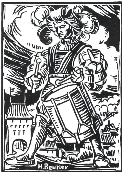
Manche seiner Sujets während der Kriegszeit waren Ausdruck geistiger Landesverteidigung gemäss der Botschaft des Bundesrates vom 9. Dezember 1938: «Der Staat muss wieder das Ziel unserer Opfer werden, nicht Opfer unserer Ziele!» (Zeichnung: Hans Beutler)