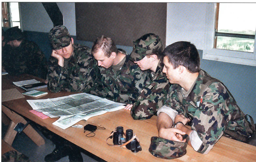
Bereiten sich auf den Übungsteil ESERCITO vor: Junge Unteroffiziere beim Studium von Gruppenführungsaufgaben.