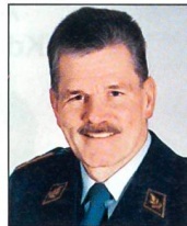
KKdt Christophe Keckeis – 2003 Generalstabschef – seit 2004 Chef der Armee

Seit 2004 ist in Friedenszeiten der Chef der Armee erster Offizier und direkt dem Verteidigungsminister unterstellt. Korpskommandant Christophe Keckeis – gleichrangig wie die Kommandanten Heer und Luftwaffe – trägt gegenüber dem Vorsteher des Eidgenössischen Departements für Verteidigung, Bevölkerungsschutz und Sport die alleinige Verantwortung für den Departementsbereich Verteidigung.