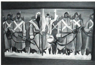
1 Ölgemälde «Beresina», 77,5 × 43,5 cm

1 Ölgemälde (ohne Titel), 38 × 135 cm Entwurf zur Landesaussstellung 1939, Zürich