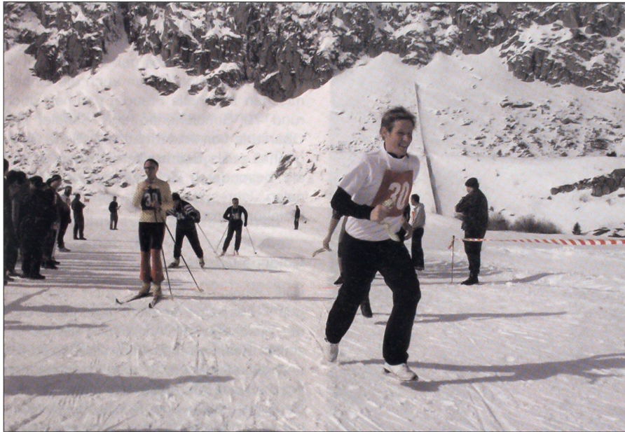
Übergaberaum beim Staffellauf.