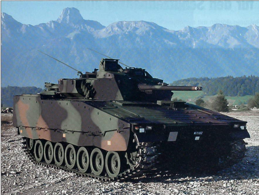
Ab März 2005 werden die Besatzungen und Truppenhandwerker des neuen Schützenpanzers 2000 mit der neuesten Trainingstechnologie ausgebildet.

ITB mit allen erforderlichen technischen Informationen unterstützen die Lernenden in der Aufgabenlösung. Die Resultate der Gruppenarbeit werden gespeichert. Anschliessend wird die Musterlösung über die Ergebnisse der Gruppenarbeit projiziert und verglichen. So erhalten die Lernenden ein tieferes Verständnis der Funktionsweise der Waffen- und Fahrzeugsysteme. Die Analysefähigkeiten für die spätere Fehlerlokalisierung werden gefördert.