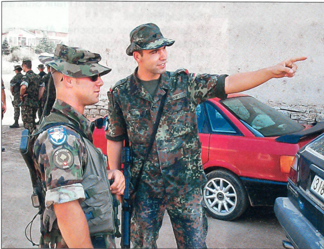
Problemlose Zusammenarbeit: Schweizer Infanterist und deutscher Jäger auf einer Patrouille.