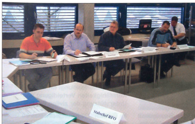
Üben von Stabsarbeit an einem Rapport.