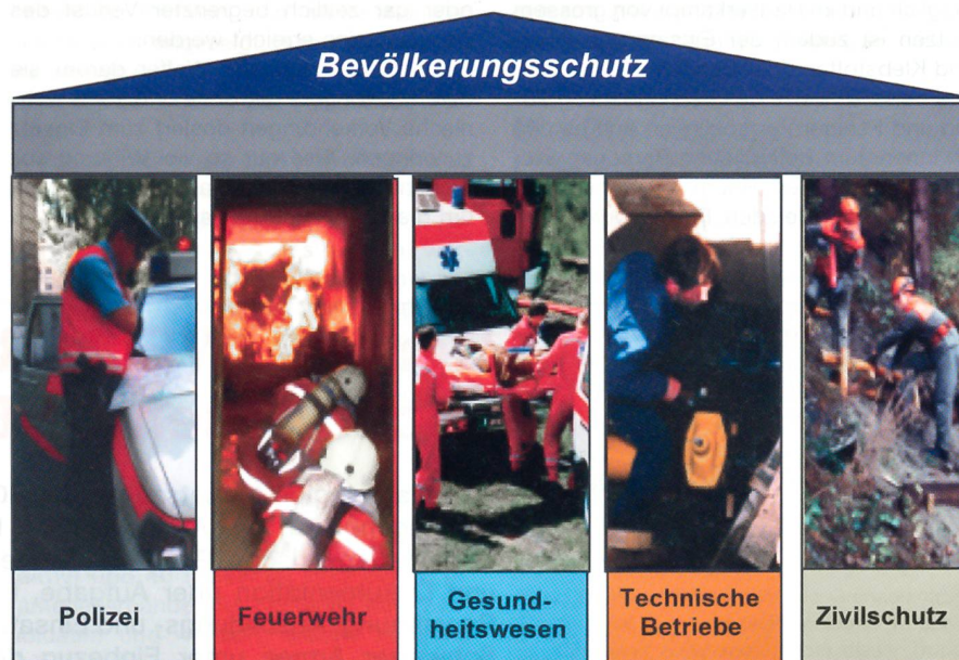
Abb. 1: Das System des Bevölkerungsschutzes mit den fünf Partnerorganisationen.

handelt werden Themen wie «Bevölkerungsschutz / Regionale Führungsorgane», «Übersicht über die Partnerorganisationen», «Infrastruktur und Organisation eines RFO», «Warnung und Alarmierung» sowie «Einführung in die Stabsarbeit». Teilnehmer sind in erster Linie alle RFO-Mitglieder. Zusätzlich können an diesem ersten Kurstag aber auch Vertreter der politischen Behörden, Feuerwehrkommandanten der Bevölkerungsschutzregion usw. teilnehmen. Der zweite Kurstag ist ein Halbtage (Vormittag) und richtet sich ausschliesslich an die Chefs und Stabschefs sowie an den Chef Lage. Als Leitung des RFO haben diese drei Personen ganz spezifische Aufgaben.