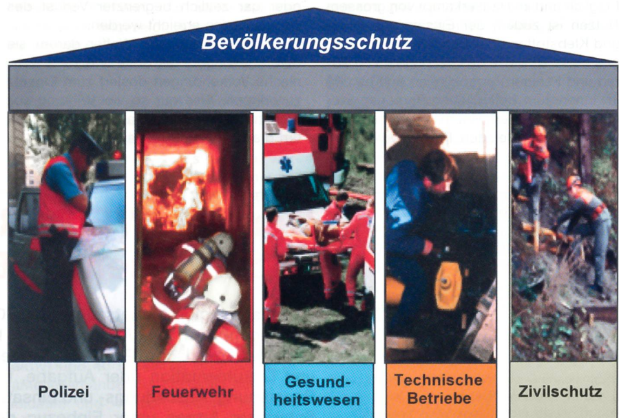
Abb. 1: Das System des Bevölkerungsschutzes mit den fünf Partnerorganisationen.

handelt werden Themen wie «Bevölkerungsschutz / Regionale Führungsorgane», «Übersicht über die Partnerorganisationen», «Infrastruktur und Organisation eines RFO», «Warnung und Alarmierung» sowie «Einführung in die Stabsarbeit». Teilnehmer sind in erster Linie alle RFO-Mitglieder. Zusätzlich können an diesem ersten Kurstag aber auch Vertreter der politischen Behörden, Feuerwehrkommandanten der Bevölkerungsschutzregion usw. teilnehmen. Der zweite Kurstag ist ein Halbtage (Vormittag) und richtet sich ausschliesslich an die Chefs und Stabschefs sowie an den Chef Lage. Als Leitung des RFO haben diese drei Personen ganz spezifische Aufgaben.