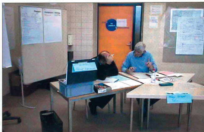
Chef und Stabschef bei der Vorbereitung eines Rapports.