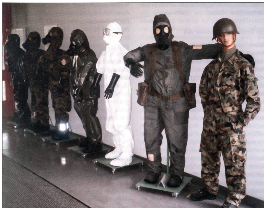
Modeschau für gefährliche Arbeiten.