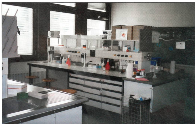
Ruhe vor dem Sturm – ein Übungslaboratorium im ABC-Kompetenzzentrum.

Am 26. April 2004 haben die ersten 31 Rekruten im Kompetenzzentrum ABC der Armee in Spiez die Fachdienstausbildung begonnen. Die Rekruten begannen die Allgemeine Grundausbildung (AGA), die für alle Angehörigen der Armee dieselbe ist, am 15. März bei der Elektromechaniker-Rekrutenschule des Lehrverbandes Logistik 2 in Lyss.