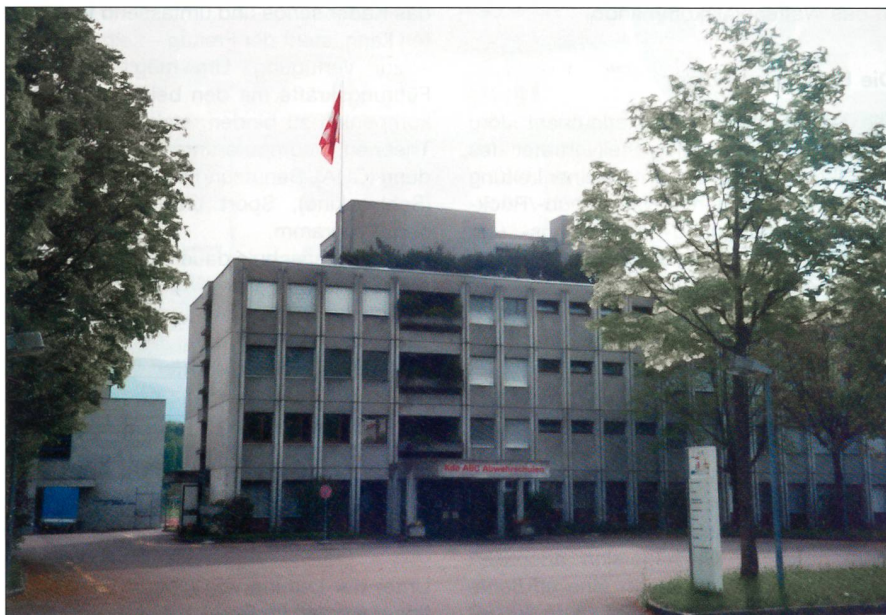
Die Zentrale der militärischen ABC-Abwehr.

Auf 1. 1. 2004 ist in der Schweizer Armee eine neue Waffengattung, die ABC-Abwehrtruppen, eingeführt worden. Seit dem 26. April haben die ersten Rekruten und