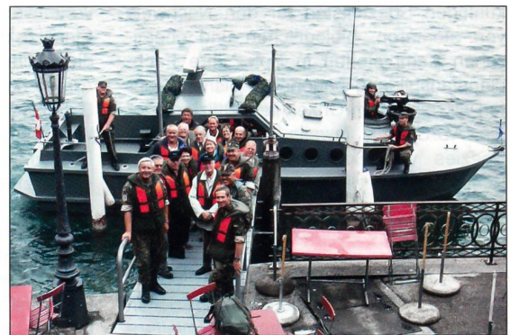
Am Landesteg in Ennetbürgen.