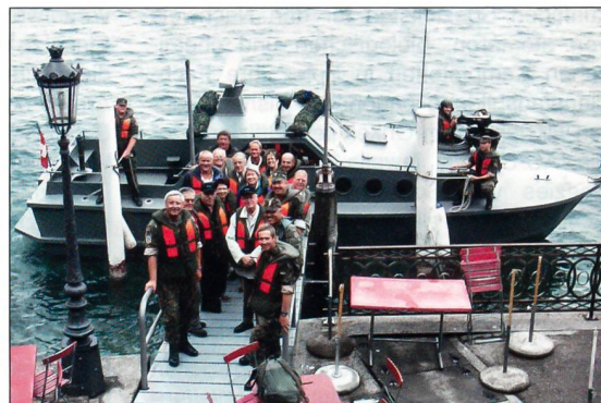
Am Landesteg in Ennetbürgen.