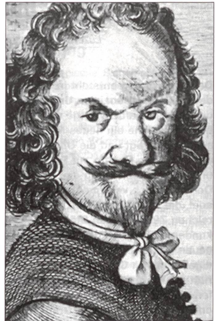
Luzerner Bauernführer Christian Schibi von Scholzmatt (Kupferstich; Zentralbibliothek, Zürich).