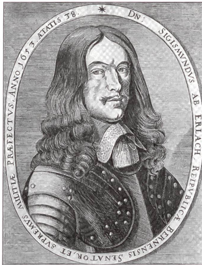
Sigmund von Erlach. Oberst und Führer der Berner Truppen im Bauernkrieg. Sein grausames Vorgehen brachte ihm den Namen «Bauernschlächter» ein. Er betrachtete die scharfe Bestrafung der Bauern als das einzige Mittel, diesem «ungeheuren Thier der Rebellion» den Kopf abzuschlagen.