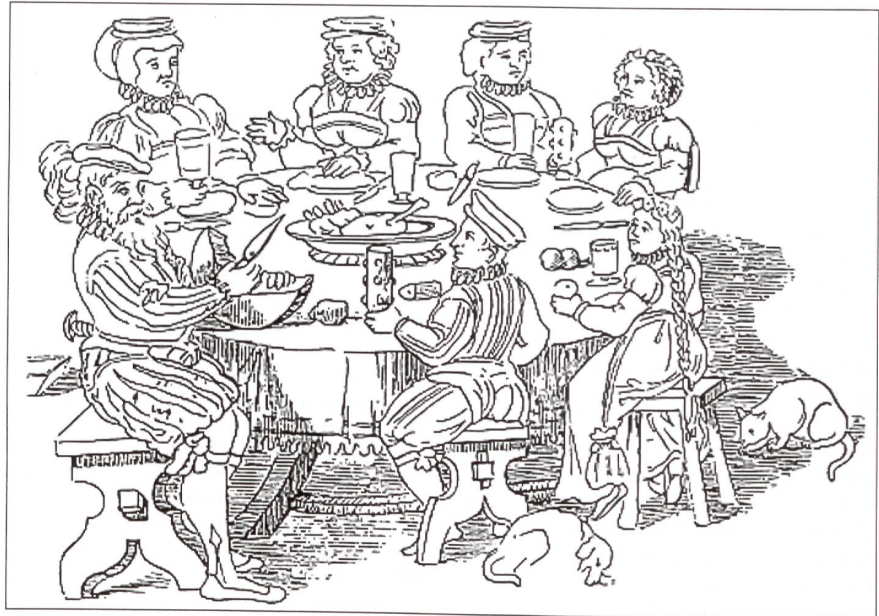
Emmentaler Bauern bei einem Festmahl, Scheibenriss von 1630.

Der Bauernkrieg entsteht in Süd-deutschland im sozialen Umbruch der Gesellschaft als Folge der Reformation, welche ein neues Menschenbild prägt und die Untertanen ermutigt, ihre Rechte auf Freiheit und Selbstbestimmung einzufordern. Der allmählich verarmende Landadel, die mächtigen Patrizier und die reichen Zünfte in den Städten bekunden Mühe, die Forderungen einer neuen Zeit anzuerkennen. Sie verteidigen ihre von Gott gegebene Autorität mit Waffengewalt und unterwerfen die aufständischen Untertanen uneinsichtig mit grosser Grausamkeit. Die Schweiz ist von diesen Unruhen erst im 17. Jahrhundert durch kriegerische Auseinandersetzungen unmittelbar betroffen. Auch hier schlägt das politische Establishment unbarmherzig zu, um seine Position zu sichern.