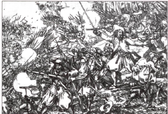
Das Gefecht von Wohlenschwil vom 24. Mai/3. Juni 1653.

Angesichts der Geschütze des Tagsatzungsheeres verlässt sie jedoch der Mut. Der Mellingervertrag vom 4. Juni 1653 bestätigt die Unterwerfung der aufständischen Bauern. Ohne Zusicherung der Straflosigkeit lösen sich die Bauernverbände auf. Die bernische Regierung – entschlossen, alles zu gewähren und nur das zu halten, was ihr beliebt – sendet 7000 Welsche unter der Führung von General Sigmund von Erlach in den Oberaargau. Bei Herzogenbuchsee bricht er am 8. Juni 1653 den letzten Widerstand der Rebellen, die sich besser schlagen als von ihm erwartet. Der Ruf als «Bauernschlächter» bleibt ihm erhalten.