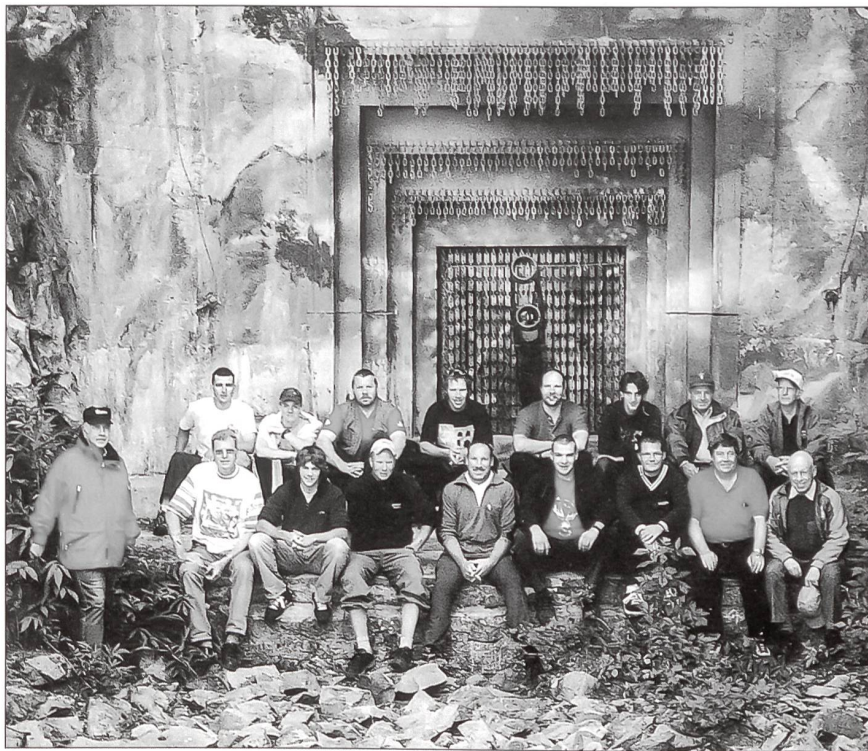
Gruppenfoto vor der sehr gut getarnten Schiesscharte mit der 10,5-cm-Kanone.

Auf dem Schiessplatz Hinterrhein wurden die Berner Oberländer Unteroffiziere durch Oberstlt Roland Griesser, Kommandant Stellvertreter Verbandsausbildung Panzer 23 (VBA Pz 23) empfangen und begrüsst.