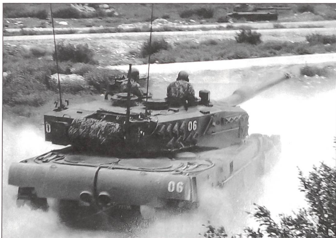
Demonstration der ausgezeichneten Beweglichkeit des Leopard-Panzers im Gelände.

kurze Nacht gehabt hätten! Am Morgen fand eine rund zweistündige Führung durch die ganze Festungsanlage statt. Alle waren tief beeindruckt von der Grösse der tief im Fels angelegten Festung mit eigener Wasserversorgung und Stromerzeugung. Die damaligen Gegner, wären sie in unfreundlicher Absicht über den Splügenpass in die Schweiz eingefallen, hätten sich wohl am Artilleriefort Crestawald die Zähne ausgebissen. In der heutigen Armee werden Festungen wie Crestawald nicht mehr gebraucht. Beweglichkeit ist heute Trumpf und deshalb sind starre Sperren keine wirklichen Sperren mehr. Als «Zeitzeuge» einer starken Sperre im Zweiten Weltkrieg hat das Artilleriewerk Crestawald seine Bedeutung aber nicht verloren.