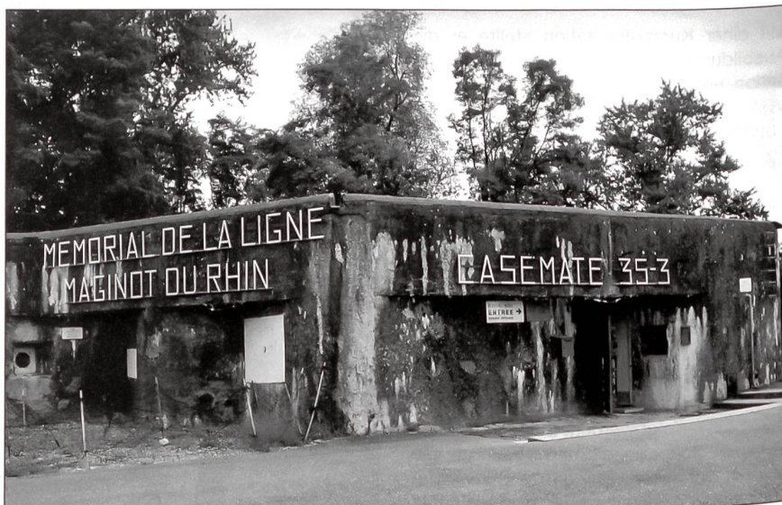
Am Eingang zum Bunker und zum kleinen Museum.

Wie an einem Sternmarsch trafen die Angemeldeten aus allen Richtungen der