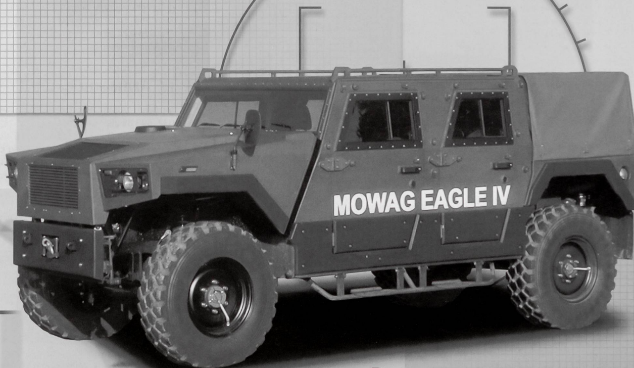
Der neue EAGLE IV 4x4

Die neu entwickelten MOWAG EAGLE IV und DURO III P bieten äusserst wirkungsvollen Ballistik- und Minenschutz bei geringem Gewicht sowie eine sehr hohe Gelände- und Strassenmobilität. Daraus resultiert eine grösstmögliche Sicherheit für Besatzung und Mannschaft.