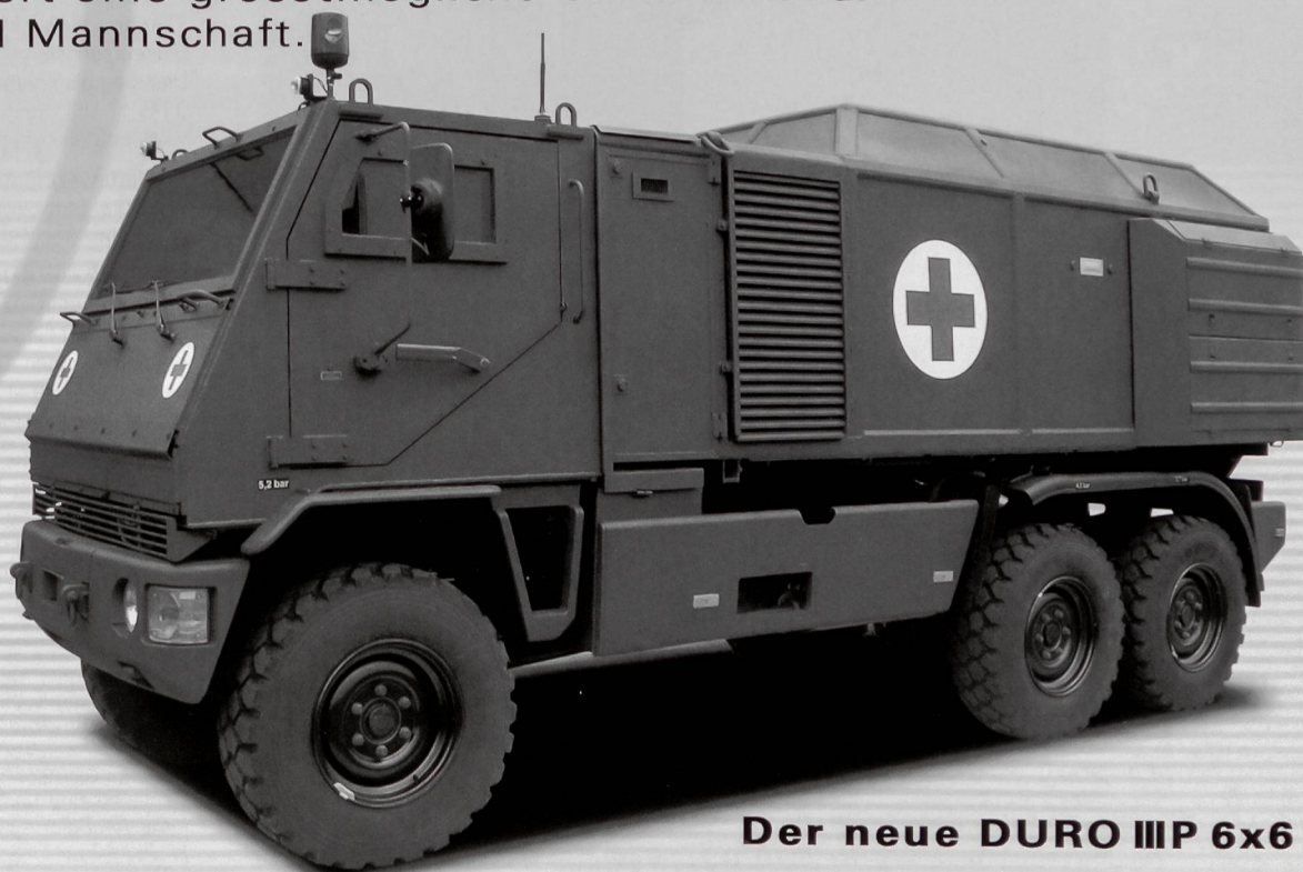
Der neue DURO III P 6x6

Die neu entwickelten MOWAG EAGLE IV und DURO III P bieten äusserst wirkungsvollen Ballistik- und Minenschutz bei geringem Gewicht sowie eine sehr hohe Gelände- und Strassenmobilität. Daraus resultiert eine grösstmögliche Sicherheit für Besatzung und Mannschaft.