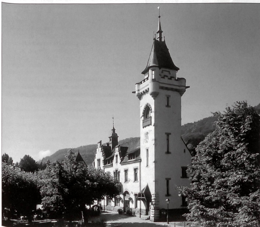
Ort der Delegiertenversammlung: Schützenhaus Albisgüetli in Zürich.