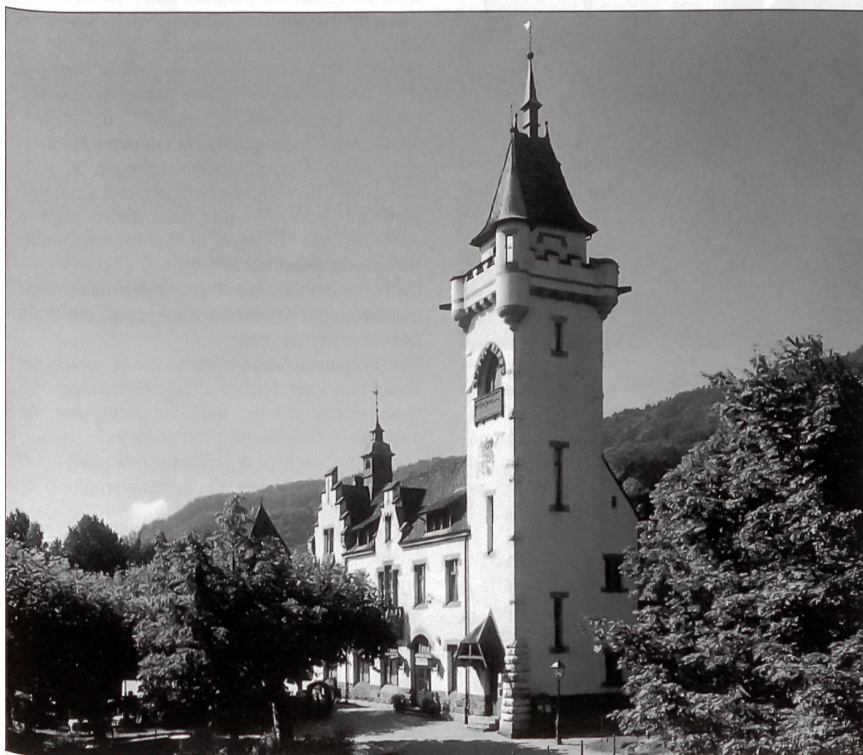
Ort der Delegiertenversammlung: Schützenhaus Albisgüetli in Zürich.