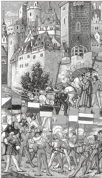
Empfang von Schweizer Söldnern durch den König von Frankreich.

Maximilian verhielt sich strategisch unklug. Statt seine Kräfte zu einem Schwerpunkt zu bündeln, verzettelte er sich in einer Reihe von Einzelaktionen. Dies ermöglichte den Eidgenossen, ihr Verteidigungsdispositiv und die Garnisonen in Sargans, im Rheintal, im Thurgau und in Baden zu verstärken. Im Osten verteidigten sich die Bündner erfolgreich im Münstertal (an der Calven) und im vorarlbergischen Frastanz. Im Norden kämpften die Eidgenossen siegreich gegen den Schwäbischen Bund vor den Toren der Stadt Konstanz (bei Schwaderloh), im Hegau und auf dem Bruderholz in Basel. Der Ausgang der Schlacht bei Dornach endlich überzeugte Maximilian von der Sinnlosigkeit weiteren Blutvergiessens. Der Frieden von Basel am 22.9.1499, vermittelt durch den Herzog von Mailand, der auf eidgenössische Hilfe zur Rückeroberung seines Herzogtums hoffte, und befördert durch den König Lud-