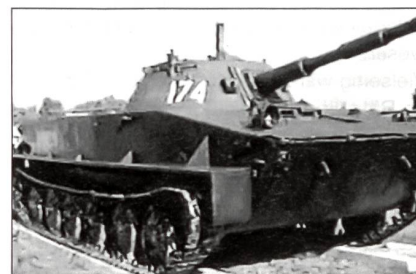
PT-76 (leichter amphibischer Panzer)