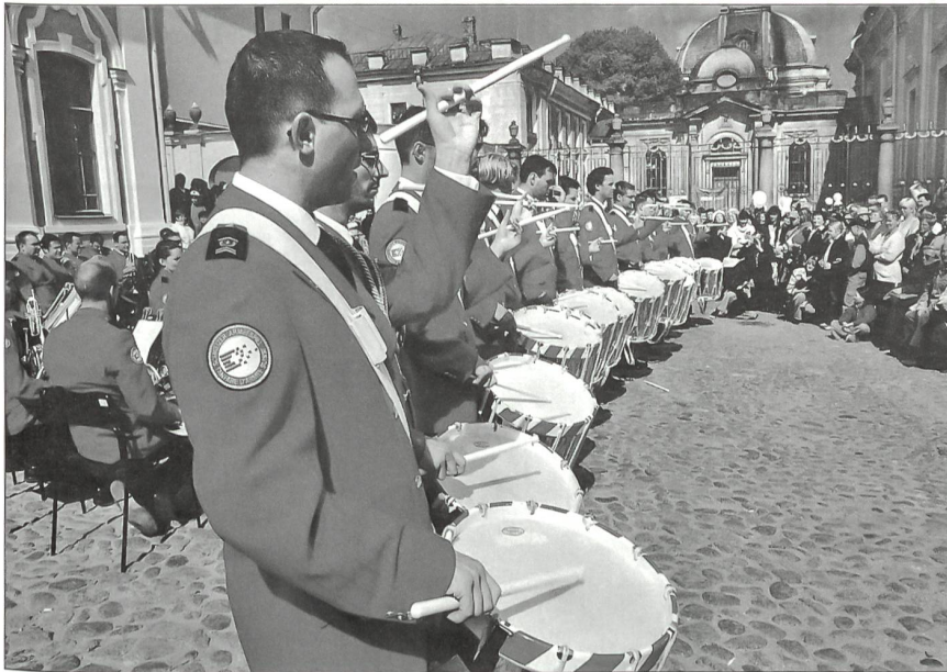
Das Repräsentationsorchester bei einem Platzkonzert in St. Petersburg.

Begegnungen wird es auch am Tattoo in Birmingham vom 25. bis 29. November kommen, an welchem das Repräsentationsorchester SAS teilnehmen wird.