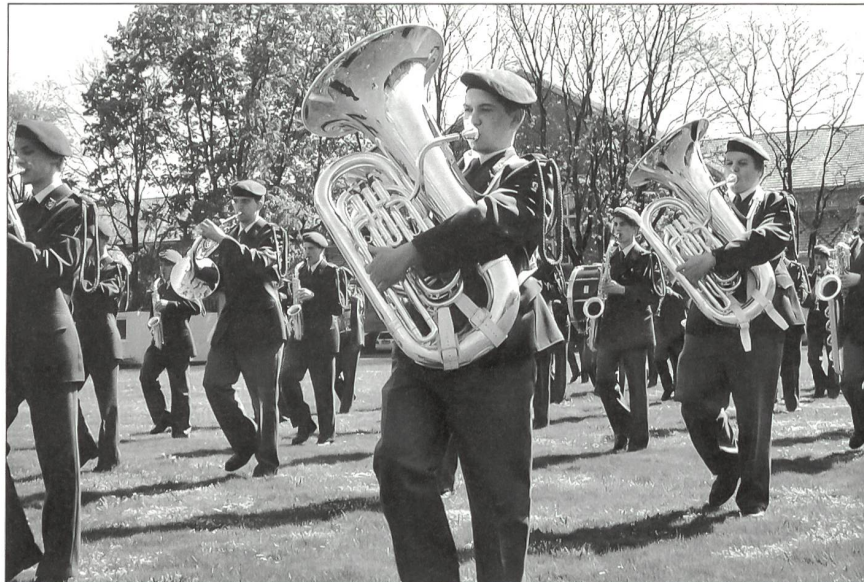
Marschmusik ist auch weiterhin eine Spezialität der Militärmusik.

Unter dem Motto «Begegnen – Erleben – und Anregen» wird zum zweiten Mal das Jungfrau-Music-Festival durchgeführt. Neben der Organisation von Konzerten gehört die Aus- und Weiterbildung von Musikerinnen und Musikern sowie des Nachwuchses zu den Zielsetzungen dieses Festivals. Zusammen mit dem Schweizer Blasmusikverband laden die Organisatoren am Samstag, 3. Juli, Blasmusikdirigentinnen und -dirigenten und weitere Interessierte in das Kultur-Casino Bern ein. Thematisiert wird die stilgerechte Interpretation moderner Unterhaltungsmusik. Die Brass Band und das Repräsentationsorchester SAS werden dieses Seminar mit musikalischen Beispielen bereichern und den Bezug zur Praxis herstellen. Der Work-