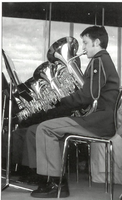
Die Euphonisten des Aarauer Rekrutenspiels bei einer Radiosendung vor dem KKL.

Die Avenicum-Musical-Parade ist eine internationale Militärmusik-Show-Parade, welche auf Initiative des Tourismusbüros Avenches seit 1999 regelmässig in der römischen Arena durchgeführt wird. Wie vor zwei Jahren wird die Parade vom 3. und 4. September mit Unterstützung der Armee organisiert und durchgeführt. In die Arena von Avenches werden Militärkapellen aus Finnland, Lettland und Marokko sowie eine Show-Kapelle aus Holland eingeladen. Das Rekrutenspiel und das Repräsentationsorchester SAS werden unser Land vertreten. Unter dem Motto «Spécial Latino» werden die beteiligten Orchester in der Arena ein musikalisches Feuerwerk entzünden. Am gleichen Wochenende wird im benachbarten Payerne die Air-Show 04 stattfinden. Vor der abendlichen Musical-Parade in der römischen Arena Avenches kann also ein weiterer spektakulärer und attraktiver Event besucht werden.