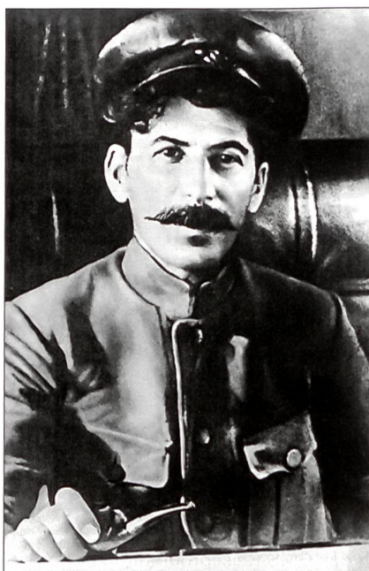
Stalin als Kommissar, 1919.

Die Zeit der asymmetrischen modernen Kriege, wie sie heute etwa der deutsche Politologe Herfried Münkler in seinem neuesten Buch «Die neuen Kriege» beschreibt, ist angebrochen. Privatleute und private Kriegsunternehmer greifen den Staat an, und zwischen den Lagern bei dieser neuen Kriegsform herrscht in keiner