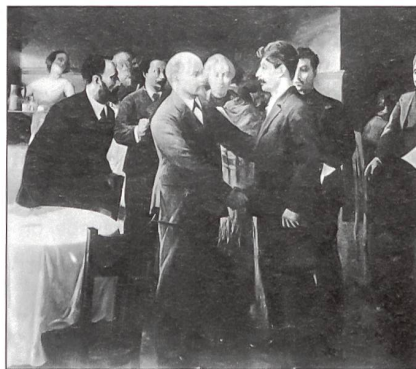
Stalins Begegnung mit Lenin in Tammerfors, 1905. Gemälde.

Der Einzige, der Stalin noch bändigen kann, ist Lenin. Die rücksichtslosen Methoden Stalins im Bürgerkrieg, der das