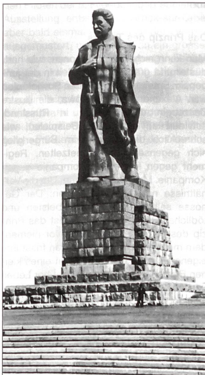
Kolossalstatue Stalins: «Stalin, Herr der Welt», (Prokofjew in der «Prawda» vom 26. Mai 1935).

Für Stalin sah die Sache anders aus. Für ihn war die Partei einerseits ein Apparat für das Leben und den Kampf der Massen; andererseits bildete dieser Apparat das revolutionäre Kampfinstrument, um die Geldmittel zu beschaffen. Dieser andere Kampf kann auch als Partisanenkrieg gesehen werden. Und hier war Stalin in seinem Element.