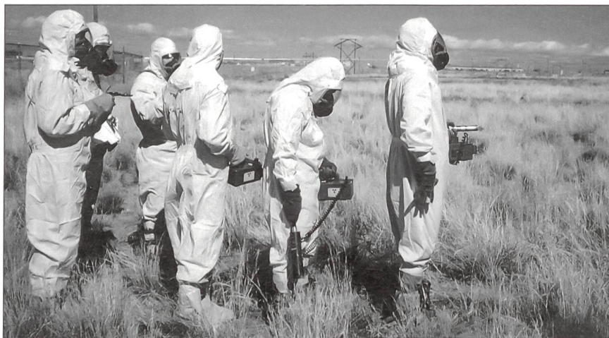
Spezialisten während einer Übung in den USA. Sie führen Messgeräte zur Messung von Alpha-, Beta- und Gamma-Strahlung mit sich.

Vor 28 Jahren bedrohte ein bis heute unbekannter Erpresser die an der Ostküste der Vereinigten Staaten gelegene Millionenstadt Boston. Er drohte mit der Zündung eines nuklearen Sprengsatzes, sollte er nicht 200 000 Dollar erhalten. Die US-Regierung reagierte sofort. Agenten des Federal Bureau of Investigation (FBI) sowie Wissenschaftler der Atomic Energy Commission wurden samt Spezialausrüstung in die Stadt eingeflogen und nahmen ihre Arbeit auf. Trotzdem war eigentlich keinem Regierungsvertreter klar, nach was und vor allem wo und wie der Sprengsatz gesucht werden sollte. Glücklicherweise stellte sich der Fall als Bluff heraus; das hinterlegte Geld wurde nicht abgeholt. Trotzdem zeigte der Zwischenfall, dass die USA gegen diese Art der Bedrohung nicht gewappnet waren. Daraufhin wurde 1975 auf Anordnung von US-Präsident Ford mit der Aufstellung des NEST (Nuclear Emergency Search Team) begonnen. Lange Zeit blieb diese Organisation vor den Augen der Öffentlichkeit verborgen. Erst Hollywood-Filme wie «Peacemaker» mit George Clooney als Army-Oberst und Nicole Kidman als Atomwissenschaftlerin der «Broken