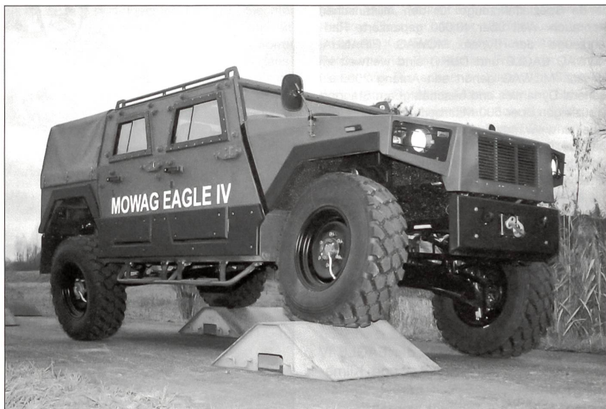
Auch in unwegsamem Gelände hat der Eagle IV noch alle vier Räder auf dem Boden.

Mit dem neu entwickelten EAGLE IV setzt MOWAG einmal mehr den Standard im Segment der gepanzerten 4x4-Fahrzeuge für den militärischen Gebrauch. Der EAGLE IV eignet sich als Aufklärungs-, Übermittlungs- oder Beobachtungsfahrzeug sowie für UN-Missionen und Grenzkontrollen. Die MOWAG-Entwicklung auf Basis des bewährten DURO-Chassis zeichnet sich durch eine sehr hohe Nutzlast bei niedrigem Gesamtgewicht, durch einen hohen Ballistik- und Minenschutz sowie eine hohe Mobilität auf der Strasse und besonders im Gelände aus. Dank der Verwendung zahlreicher baugleicher Teile der DURO-Familie können die Unterhalts- und Ausbildungskosten bei einem Flotteneinsatz tief gehalten werden.