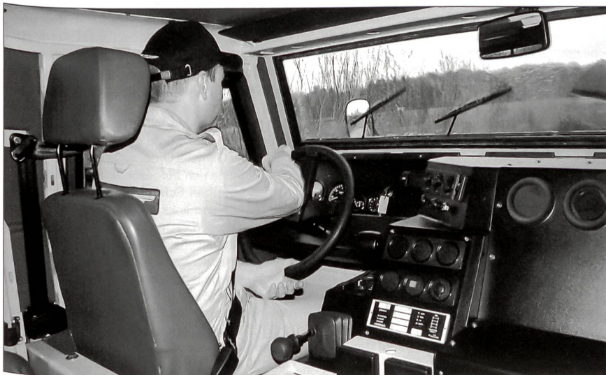
Die grosszügige Kabine bietet hohen Fahrkomfort.

Dem Schutz der Besatzung kommt gerade in UN-Missionen eine hohe Bedeutung zu. Der EAGLE IV erfüllt im Schutz gegen ballistische Waffen die internationale Norm STANAG 4569 Level 3 (7.62 AP, 30 m) und im Minenschutz die Norm STANAG 4569 Level 2a (6 kg TNT). Für Einsätze mit geringer Gefahr ist der EAGLE IV auch in einer ungeschützten Version erhältlich, die Besatzungskabine kann einfach gewech-