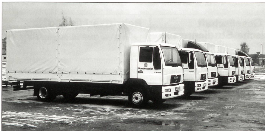
Die ersten sieben MAN-Lastwagen aus der L2000-Evolution-Baureihe stellte der BwFuhrparkService in Dienst. Sie sind Bestandteil des neuen Mobilitätsmanagements der Bundeswehr.

Das im Vertrag beinhaltete Servicepaket MAN ComfortPlusService umfasst alle grundlegenden Wartungsdienste inklusive einer erweiterten Garantie auf den MAN Antriebsstrang. Zusätzlich enthalten sind die gesetzlich vorgeschriebenen Untersuchungen. Für die Wartung der Lastwagen sorgen neben den vom BwFuhrparkService aufgebauten Mobilitätscentern auch die 393 MAN-Servicestützpunkte in Deutschland. Europaweit stehen den MAN-Kunden insgesamt rund 1200 autorisierte Stützpunkte für Service und Fahrzeuginstandsetzung zur Verfügung. ☐