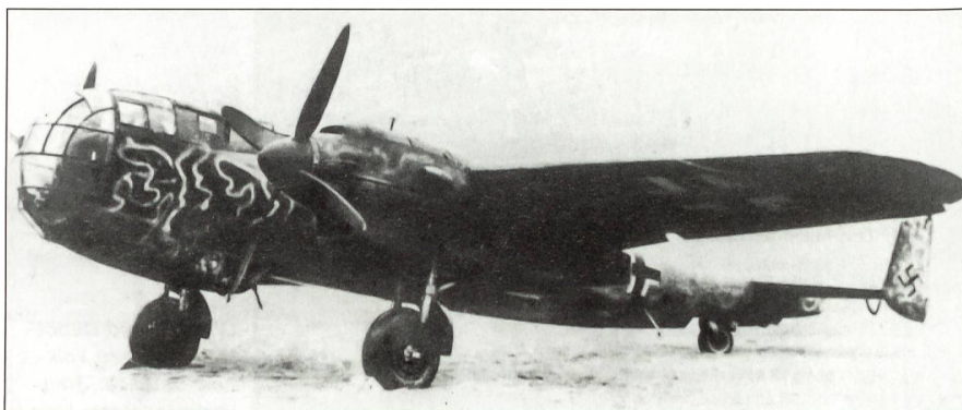
Von einer Dornier 217K-1 wurde die Bombe abgeworfen.