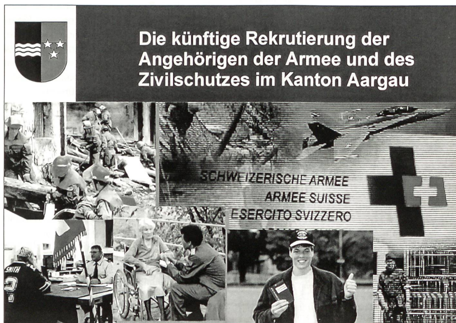
Die zukünftige Rekrutierung.