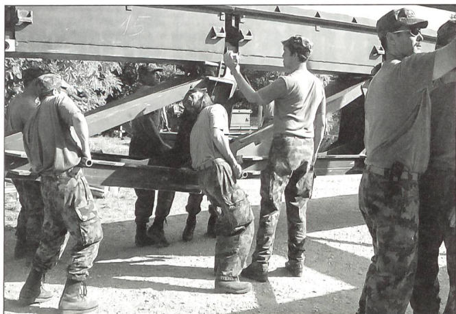
Anlässlich «Besuchstag» des G Bat 5 im Mittelland.