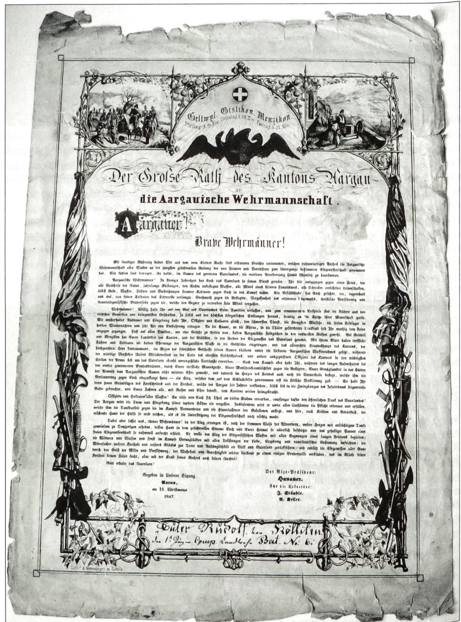
Die aargauische Wehrmannschaft.

Burgen, Schlösser und Klöster legen Zeugnis ab aus der Zeit des Hoch- und Spätmittelalters im Kanton Aargau. Eines der wichtigsten Adelsgeschlechter waren die Grafen von Lenzburg. Nach ihrem Aussterben übernahmen erst die Kyburger und nachher die Habsburger die Lenzburg. Im 12. und 13. Jahrhundert bauten sie auch ihre Landesherrschaft aus und gründeten