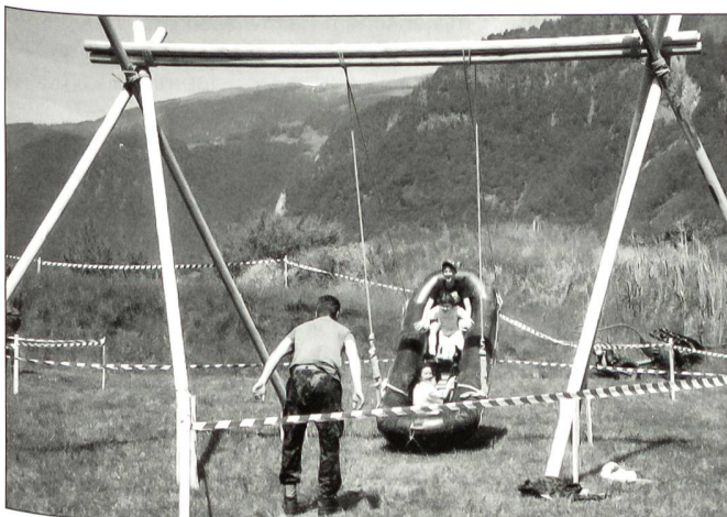
Sehr beliebt bei den Kindern, die originelle Schaukel mit dem Schlauchboot.

Als am Schluss der Vorführungen zwei Alouette 3 und ein Super Puma mit den angehängten Fahnen und dem Wahrzeichen der LTG 5 und LT Abt 5, einer aus Holz von einem Geniesoldaten kunstvoll gefertigten grossen Heuschrecke zum letzten Male vorbeiflogen, kam doch unter den Zuschauern eine gewisse Wehmut auf. Mit dem Spruch «Nicht traurig sein, das Leben geht weiter», zerstreute der Speaker diese aber rasch. Nun schwirren die auf dem Bödeli gerne gesehenen Heuschrecken endgültig weg von Interlaken. Beim Wegfliegen rufen sie allen zu, addio Interlaken, auf Wiedersehen in Payerne! ☒