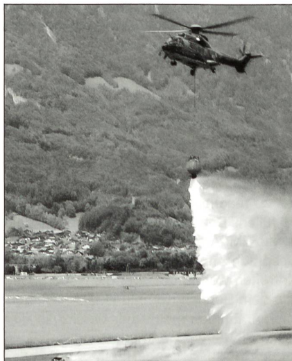
Präzis entleert der Pilot den Wasserbehälter über dem Feuer.

Interlaken stationiert. Für die gute Zusammenarbeit bedankt sich die Truppe auf diesem Wege herzlich bei den Behörden. Ein weiteres Dankeschön geht auch an die Adresse der Bevölkerung, welche immer grosses Verständnis für den Fluglärm bei Tag und Nacht hatte. Gegen 500 Armeeangehörige absolvierten jährlich ihren dreiwöchigen Wiederholungskurs in Interlaken. Die Truppe arbeitete mit den Gemeinden gut zusammen und wurde von diesen auch tatkräftig unterstützt.