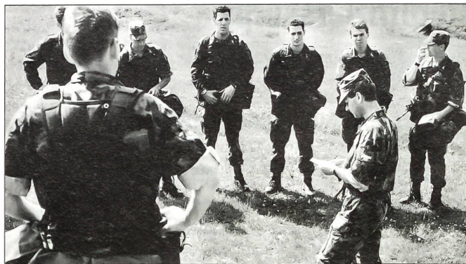
Unteroffiziere bilden Unteroffiziere aus.

-graden soll primär eine klare Abgrenzung der entsprechenden Verantwortungs- und Kompetenzbereiche ermöglichen.