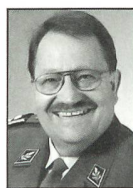
Div Waldemar Eymann Chef des Personellen der Armee

In den nächsten Jahren haben die Kantone im Rahmen der Rekrutierung A XXI jährlich 600 bis 900 Orientierungstage mit jeweils 40 bis 60 Teilnehmenden vorgesehen. Sie werden von Moderatorinnen und Moderatoren, die die Kantone stellen, begleitet und informiert. Die Inhalte und die eingesetzten Instrumente sind Sache des Bundes; ebenfalls die Ausbildung des kantonalen Personals, das an den Orientierungstagen den persönlichen Erstkontakt der Jugendlichen mit der Armee prägt. Im ZIKA rechnet man damit, dass bis Mitte nächsten Jahres gegen 360 Moderatorinnen und Moderatoren ausgebildet werden müssen.