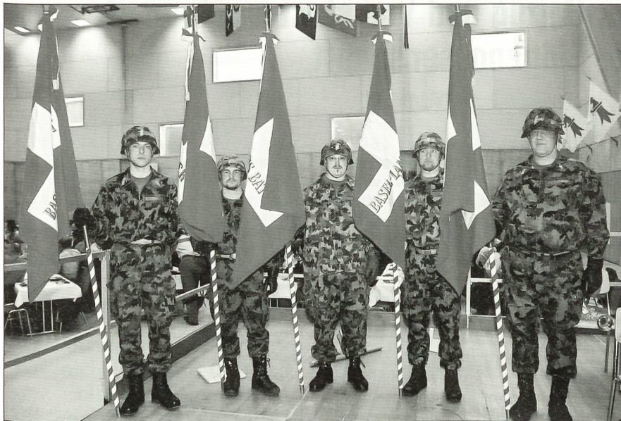
Letzter Auftritt der Fähnriche.